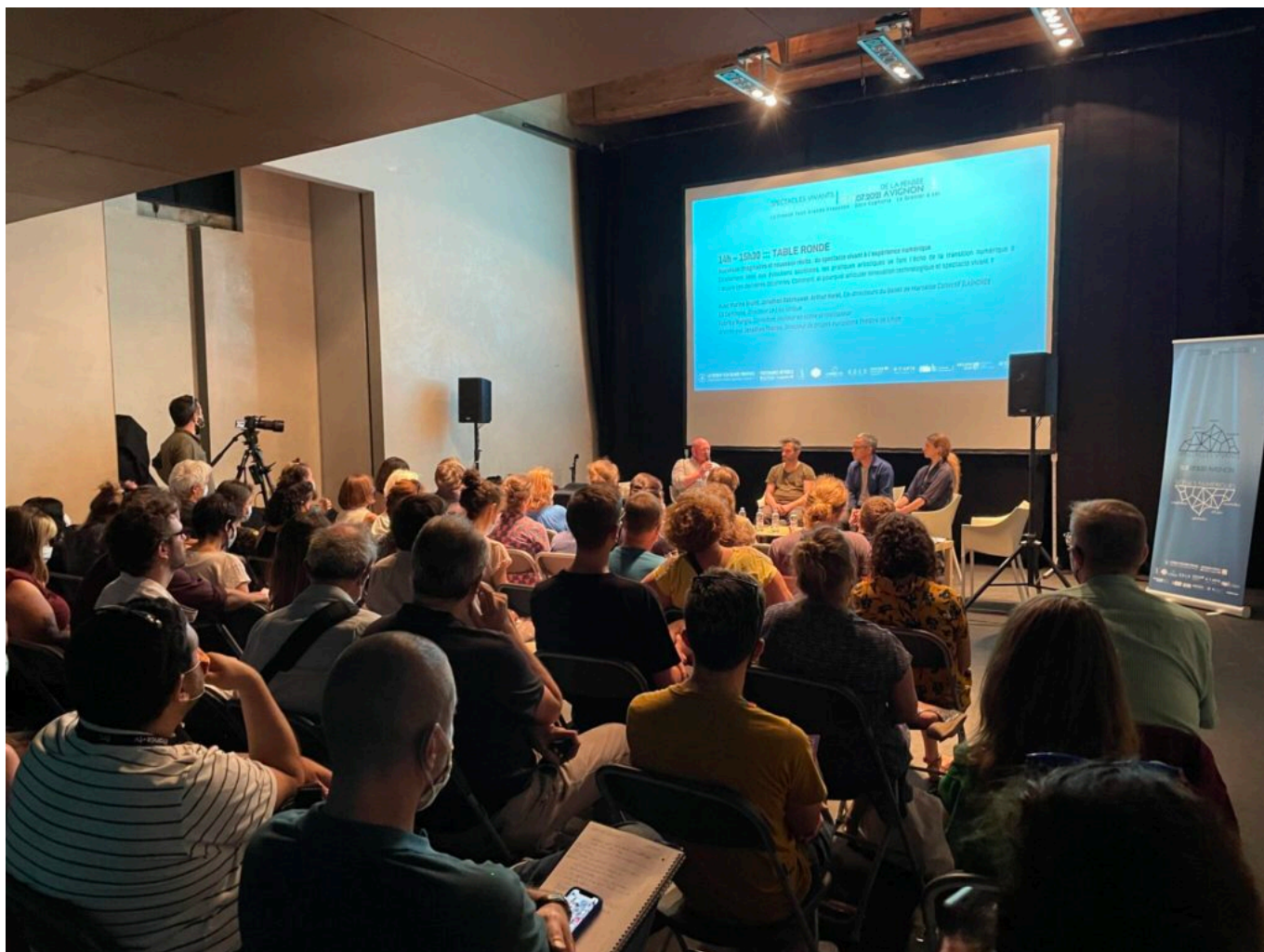
Carton plein pour les rencontres de la French Tech Grande Provence.