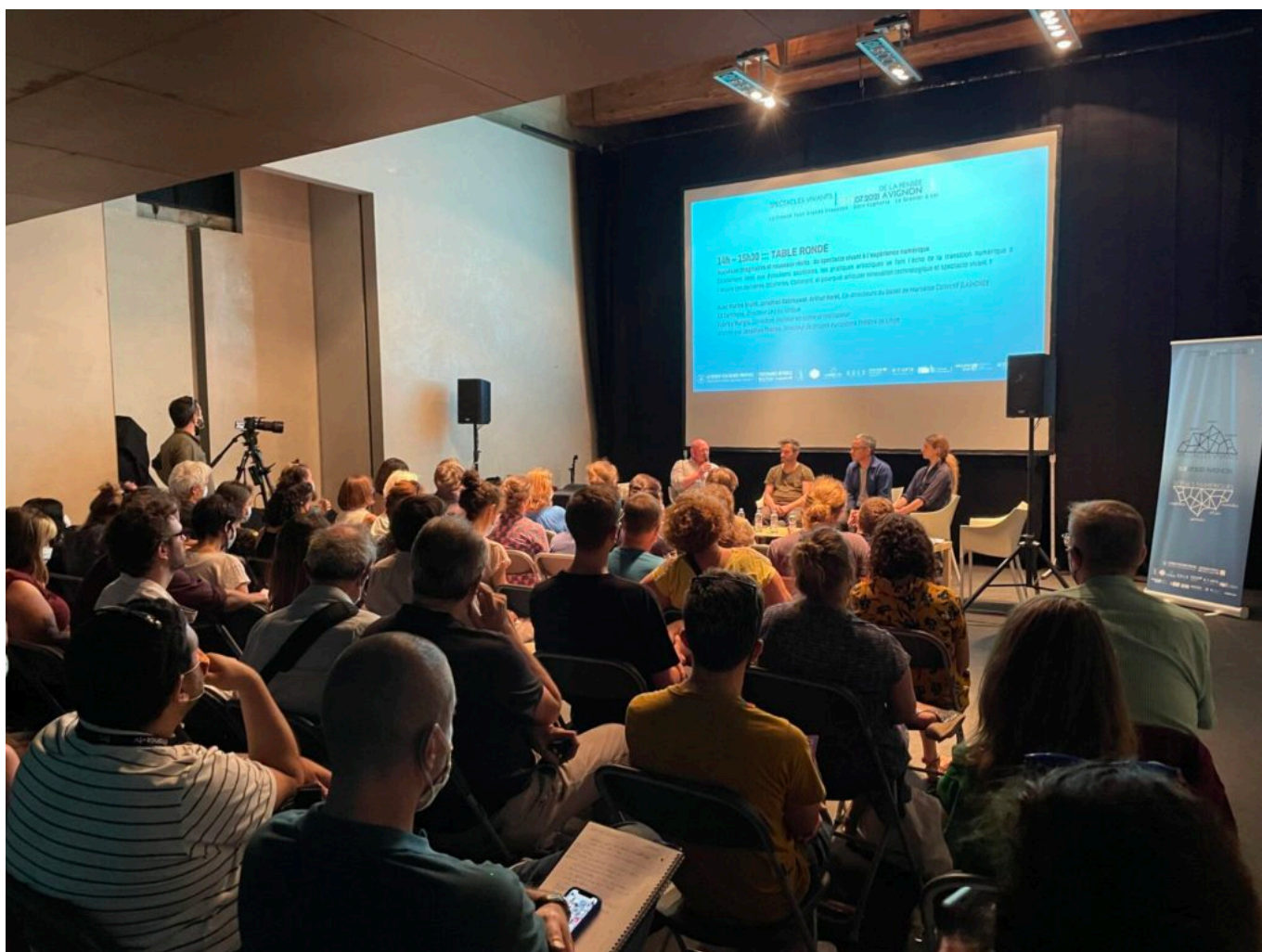
Carton plein pour les rencontres de la French Tech Grande Provence.