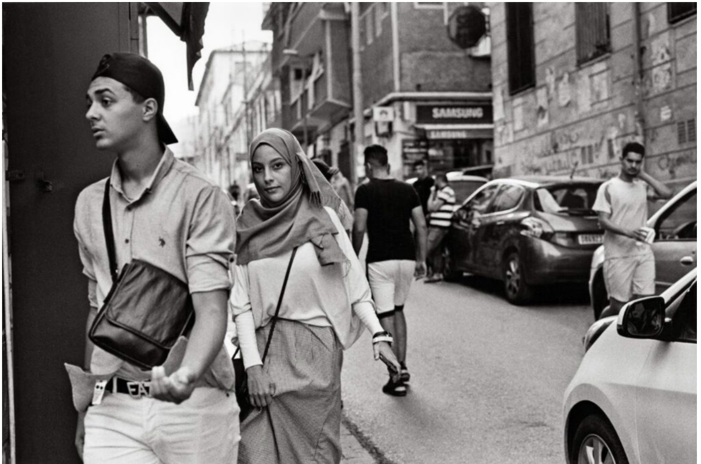
Alger, 2019

En 2019, alors qu'il souhaite pour la première fois publier ces photographies de 1961, Raymond Depardon réalise un nouveau voyage à Alger. « Nous sommes venus dire bonjour aux gens comme des touristes. La langue française est d'ailleurs un lien entre nos deux territoires », se souvient-il. Après Alger, il se rend à Oran pour y retrouver l'écrivain Kamel Daoud. De là, naît l'idée d'un livre et d'une exposition réunissant les photos des deux voyages de Depardon et les textes de l'auteur algérien. « Il y a beaucoup de jeunesse et d'espoir à Alger », assure le photographe, exposant même une dernière idée : « J'aimerais beaucoup que ces photos soient exposées aussi en Algérie, c'est leur Histoire aussi, j'aimerais leur en faire don. »