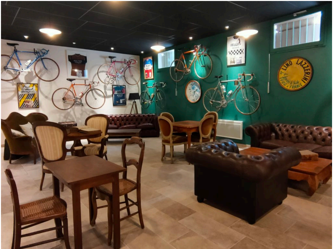
Un endroit rêvé pour les nostalgiques du vélo...