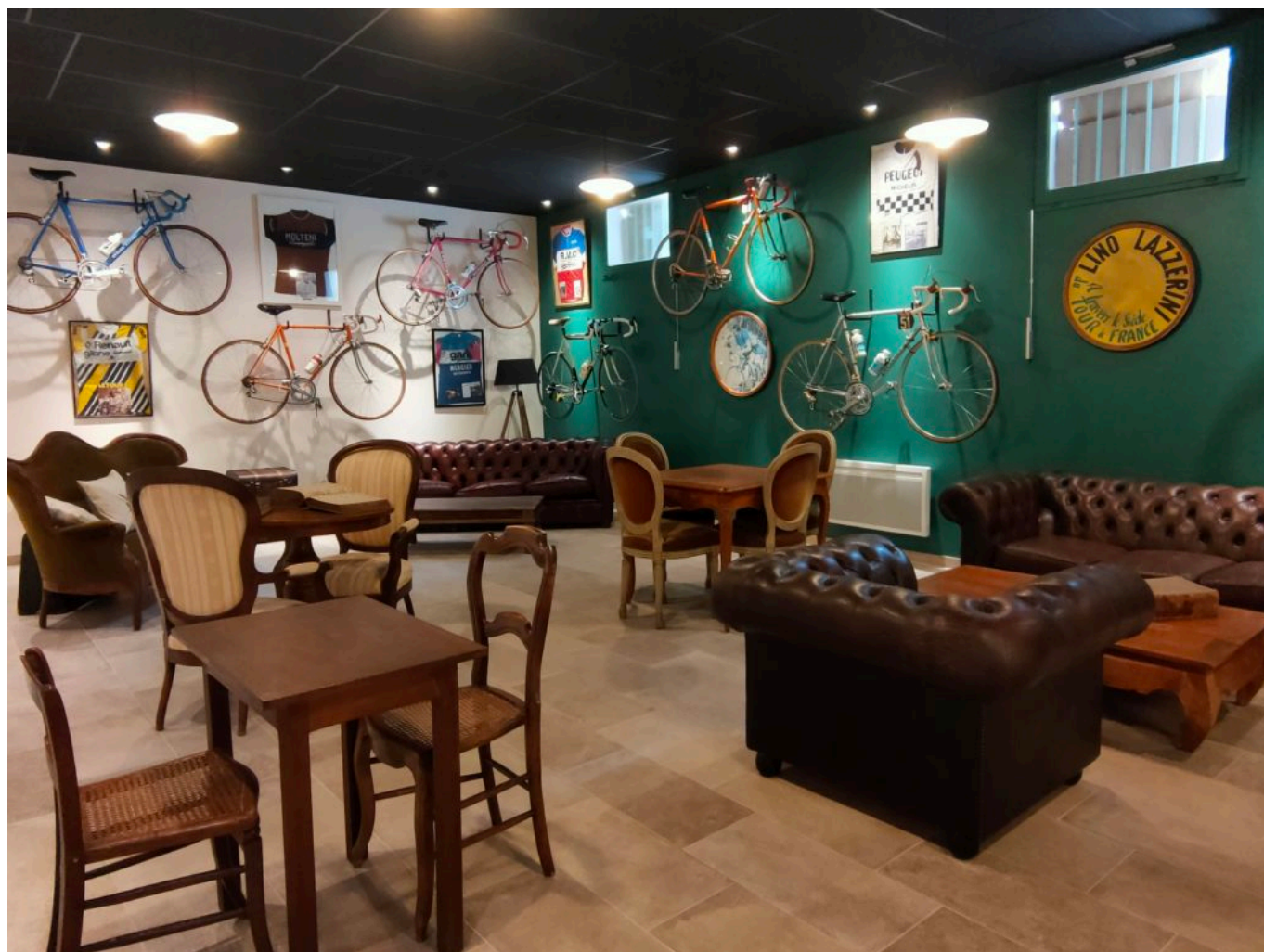
Un endroit rêvé pour les nostalgiques du vélo...