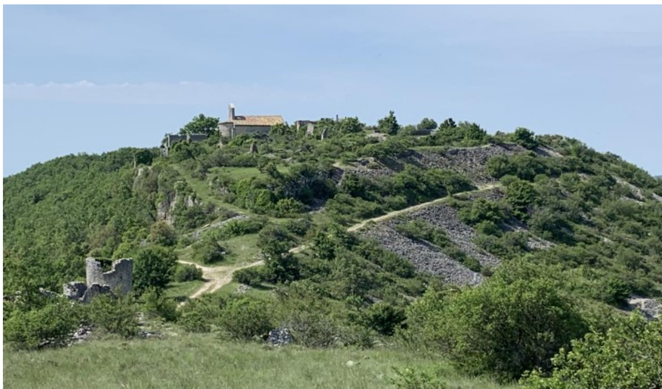
Sur les chemins de randonnée

Inscription nécessaire à l'adresse mail : resa.lebleuet@orange.fr