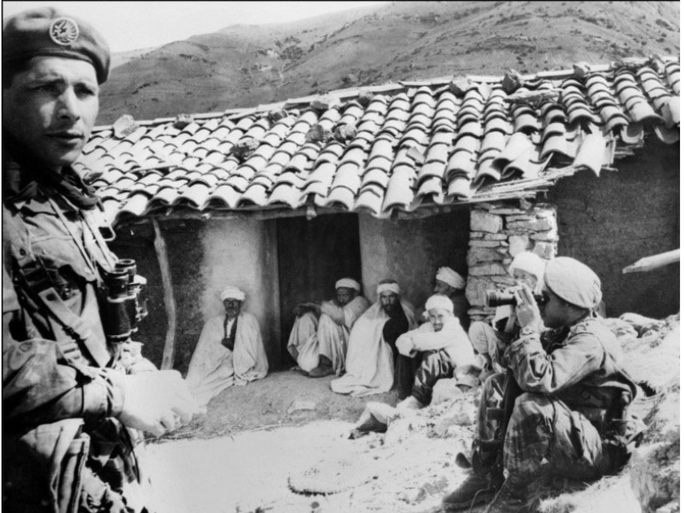
La guerre en Algérie