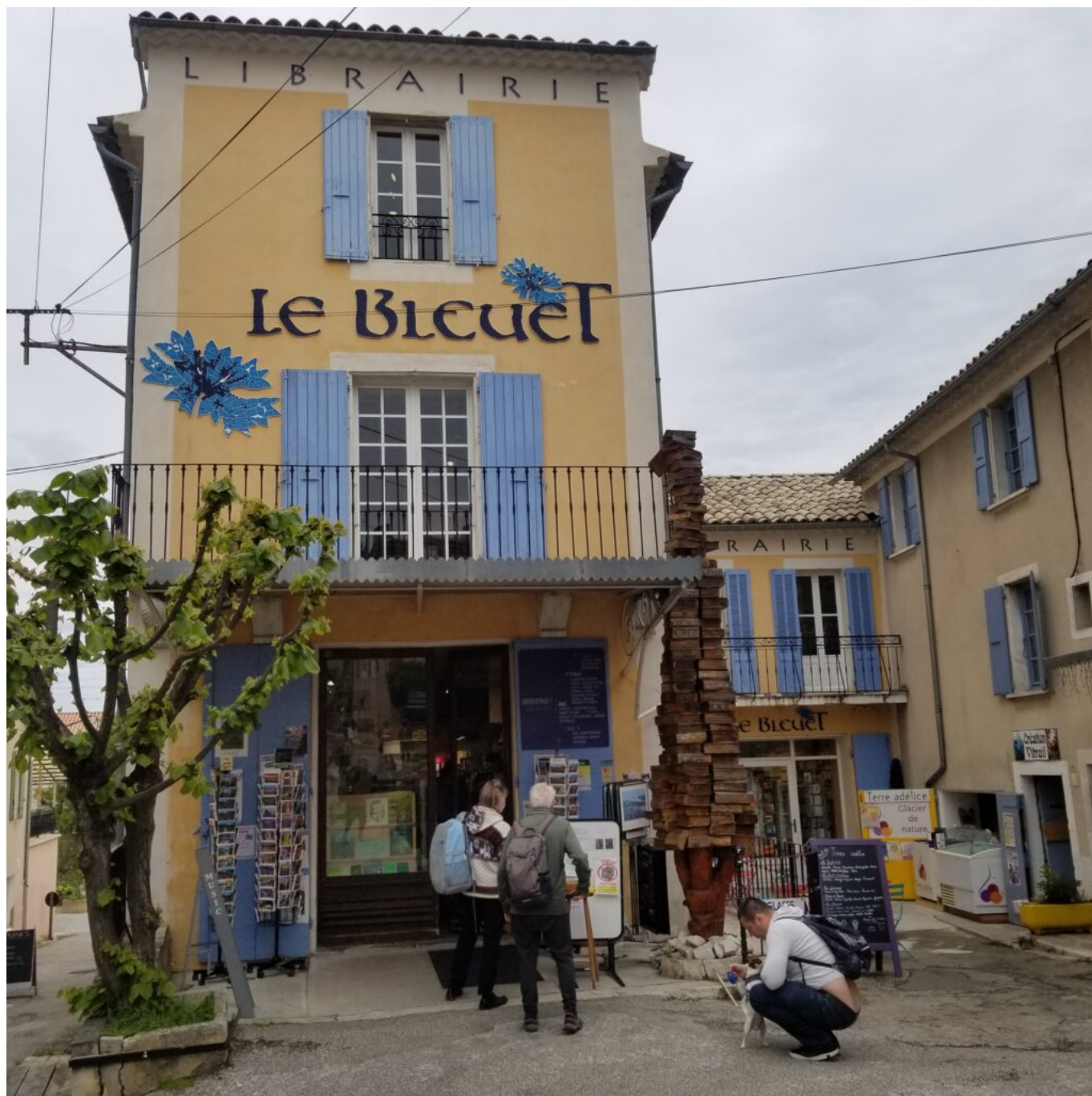
La Librairie le Bleuet à Banon

Ecrit par Mireille Hurlin le 3 novembre 2022