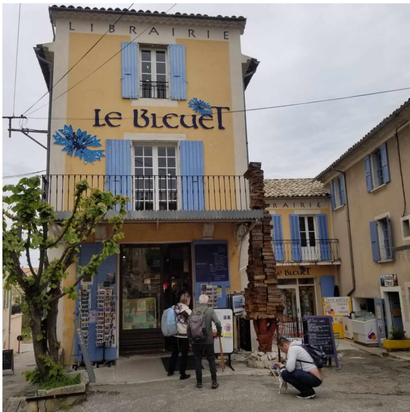
La Librairie le Bleuet à Banon

Ecrit par Mireille Hurlin le 3 novembre 2022