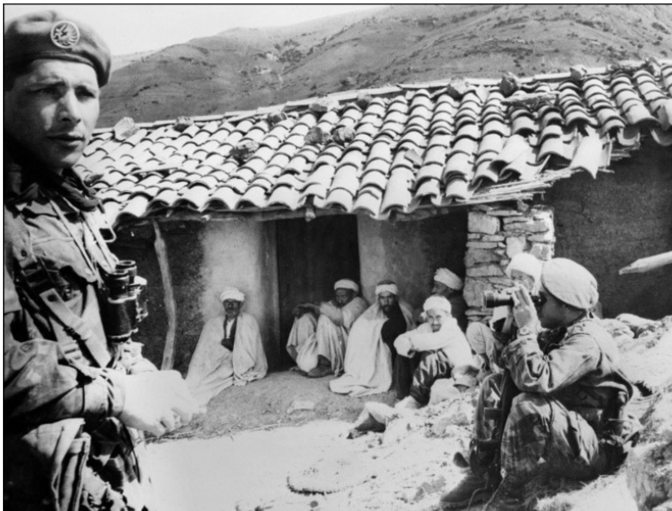
La guerre en Algérie