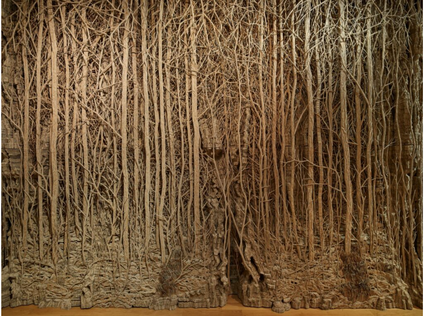
La forêt de Galeria DR