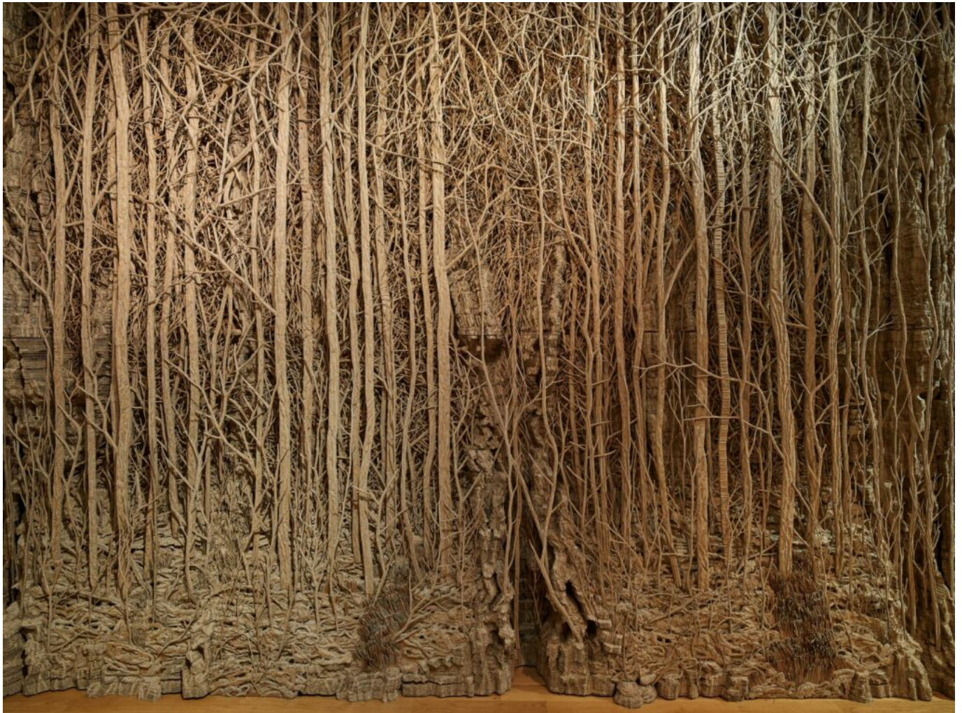
La forêt de Galeria DR