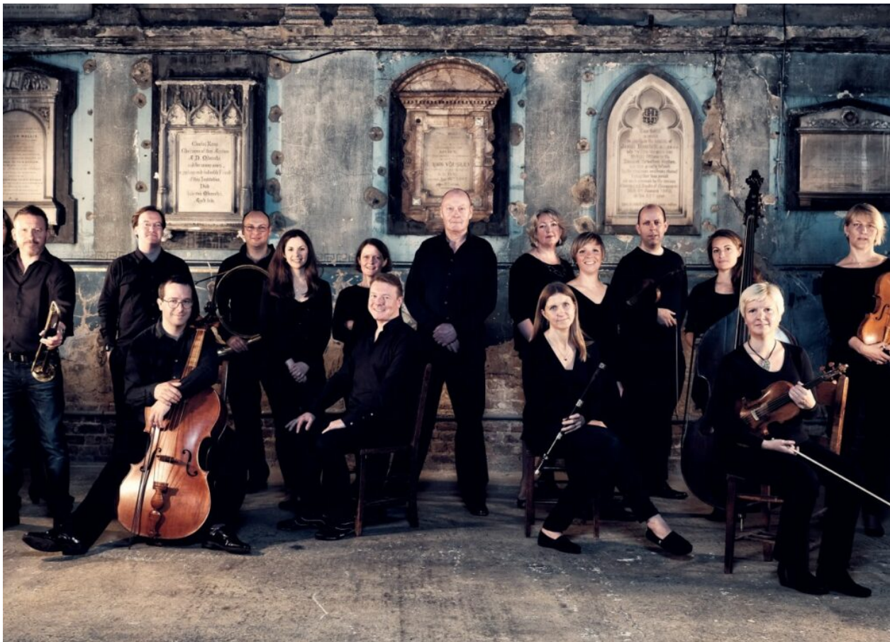
«King Arthur» par le Gabrieli Consort le 09 juillet place de l'Horloge à Ménéribes

A Ménéribes le 9 juillet, mais en plein air sur la Place de l'Horloge l'opéra « King Arthur » de Purcell qui sera dirigé par le londonien Paul Mac Creesh à la tête de son Ensemble Gabrieli Consort & Players et de sopranos, ténors baryton et baryton-basse réputés.