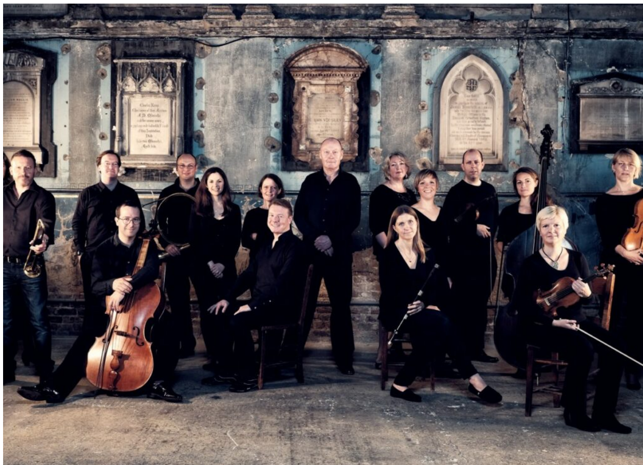
«King Arthur» par le Gabrieli Consort le 09 juillet place de l'Horloge à Ménéribes