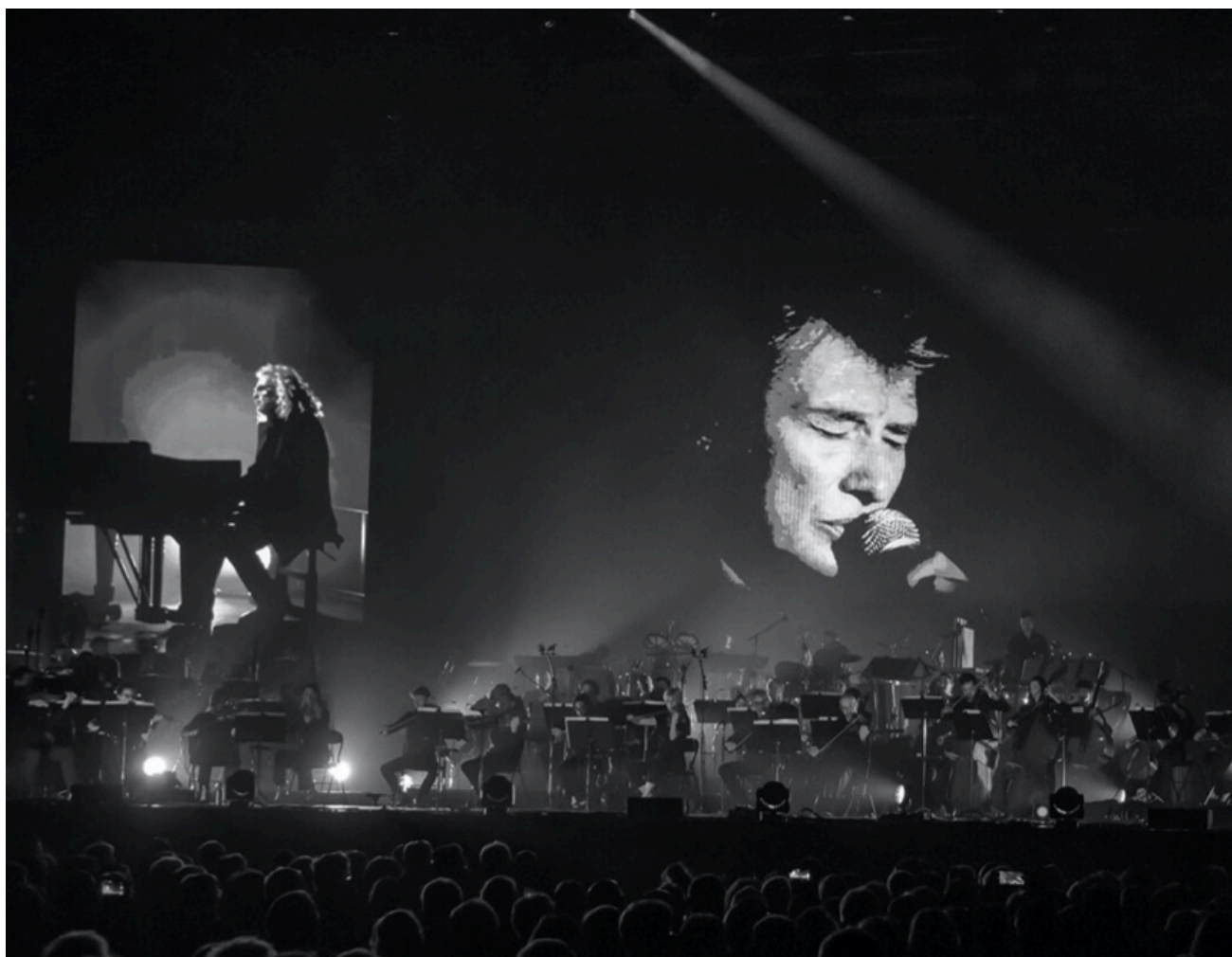
Johnny Symphonique.

Ecrit par Andrée Brunetti le 22 novembre 2024