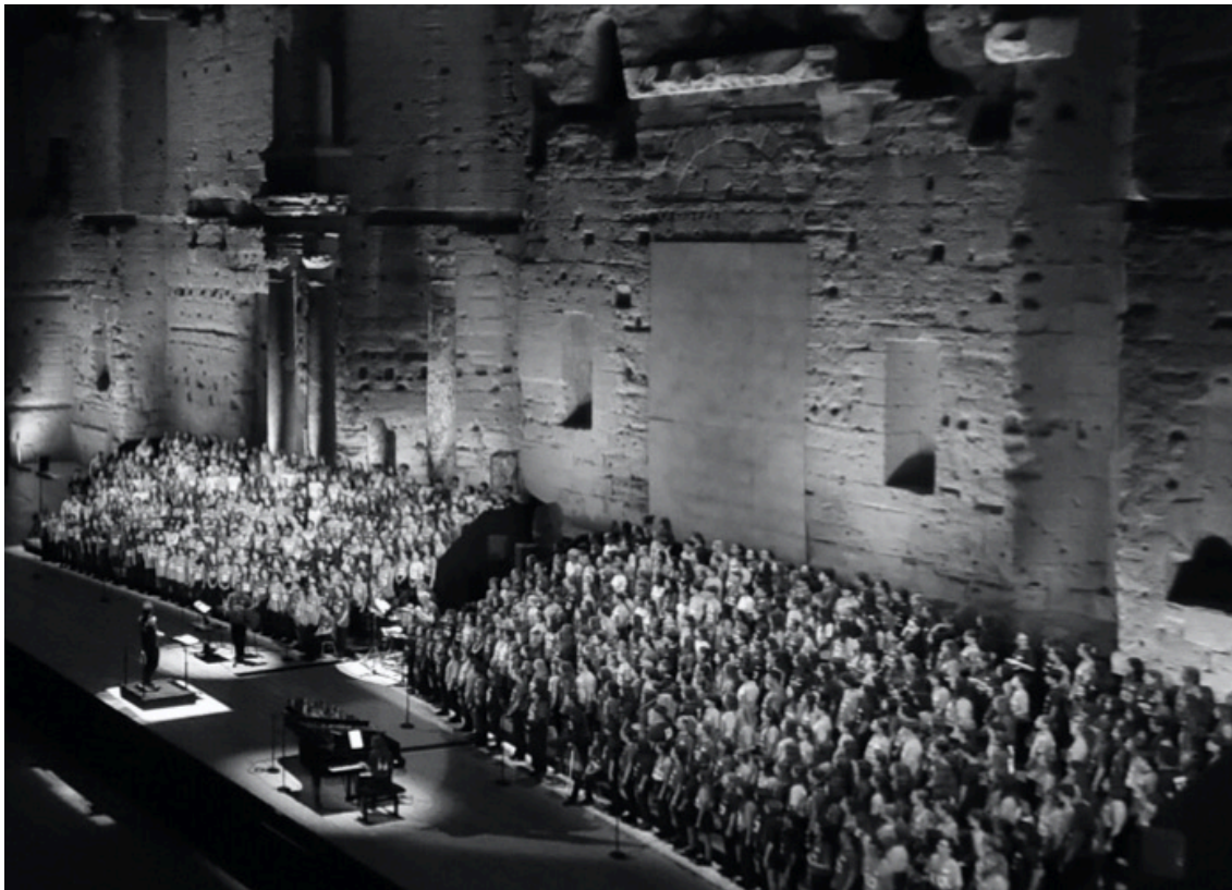
Pop the Opera.