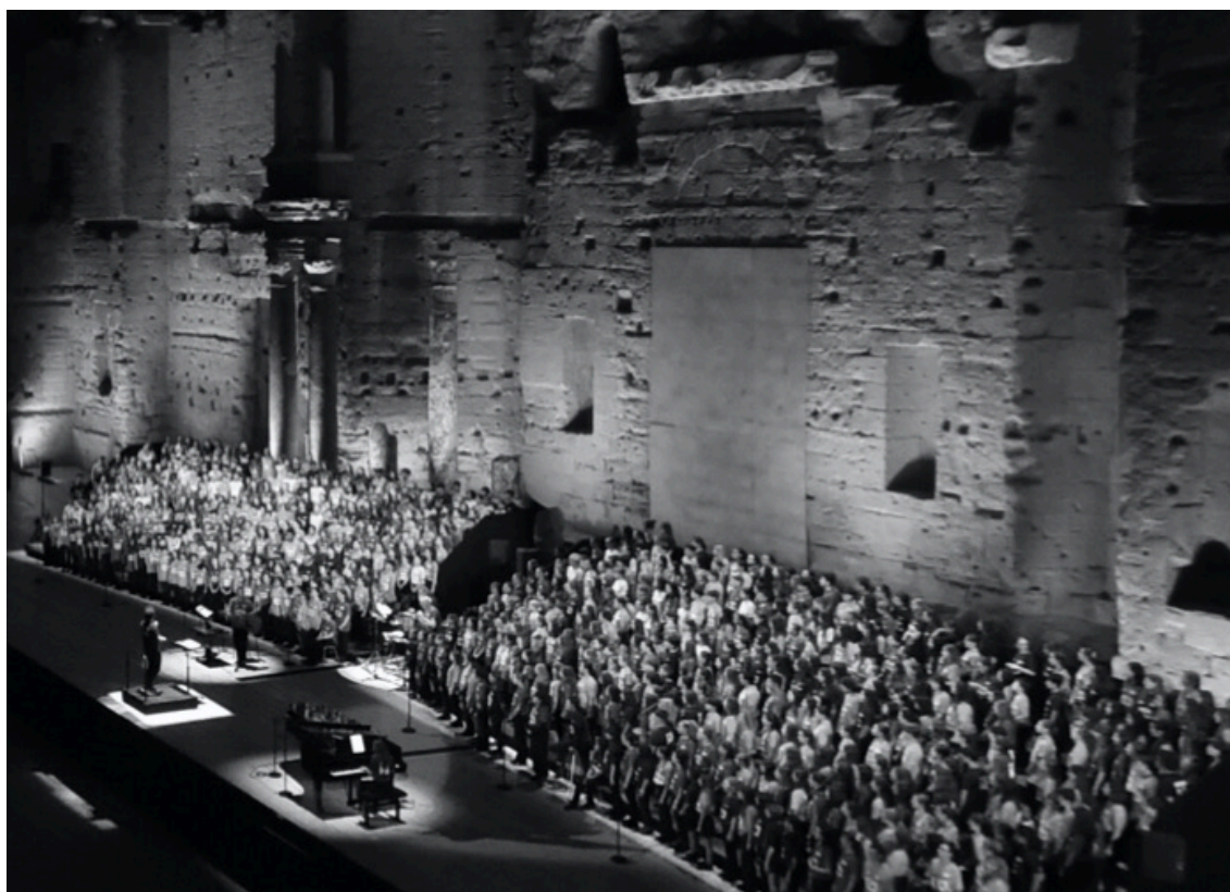
Pop the Opera.