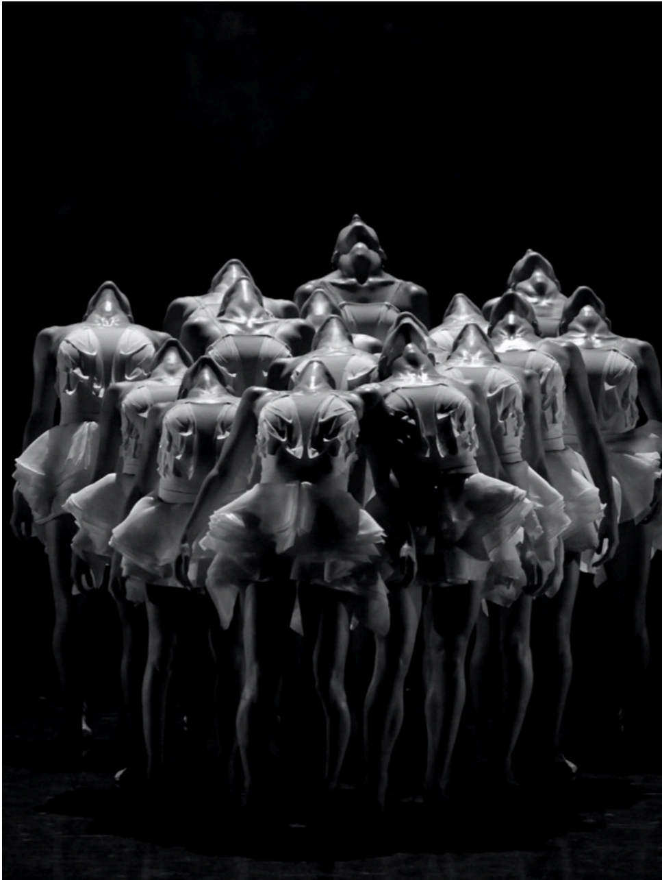
Le Lac des Cygnes.

Ecrit par Andrée Brunetti le 22 novembre 2024