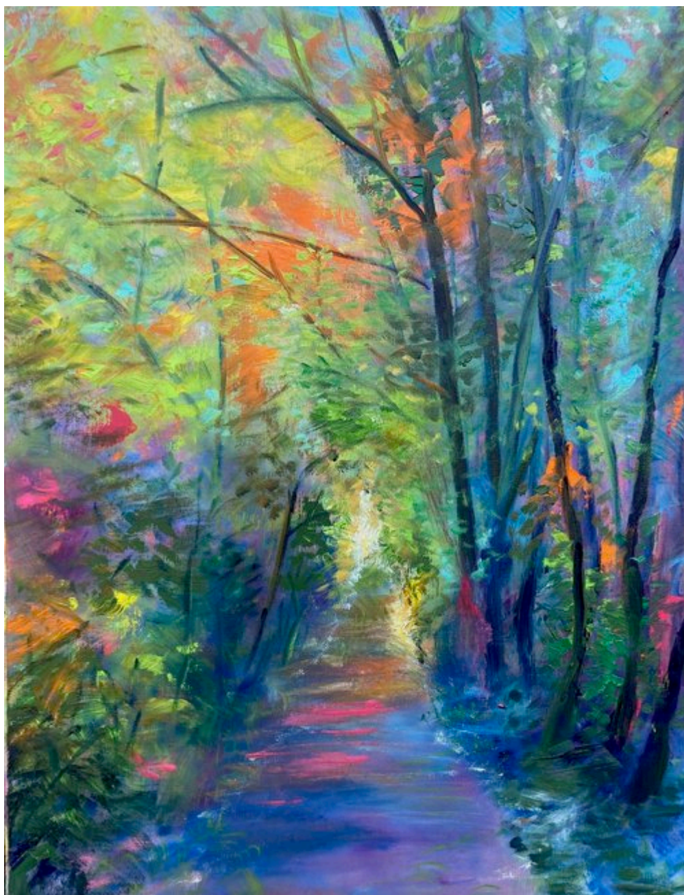
L'ETE « série les saisons » huile sur toile de lin 61 x 46.