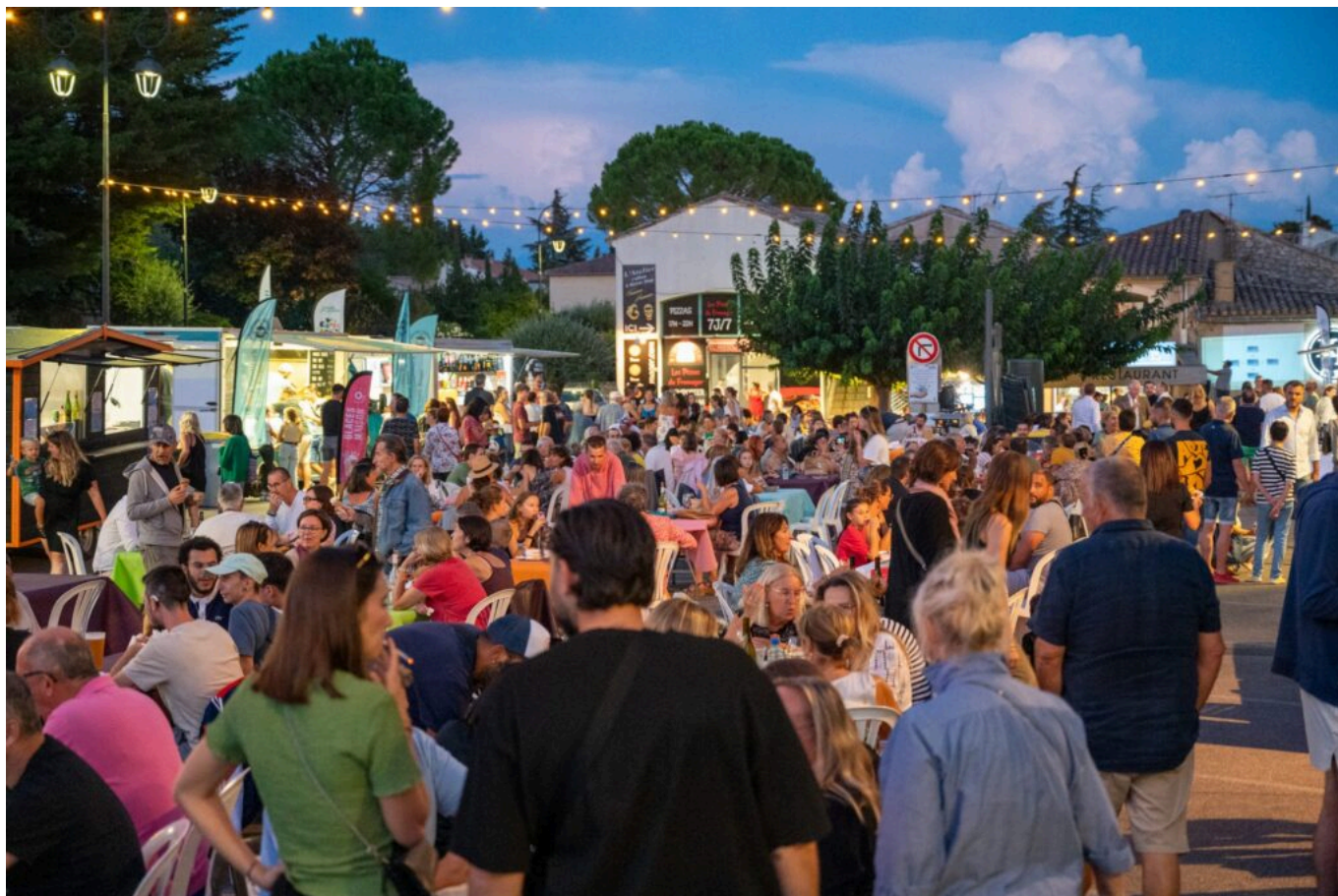
La soirée des Défis Foodtruck.