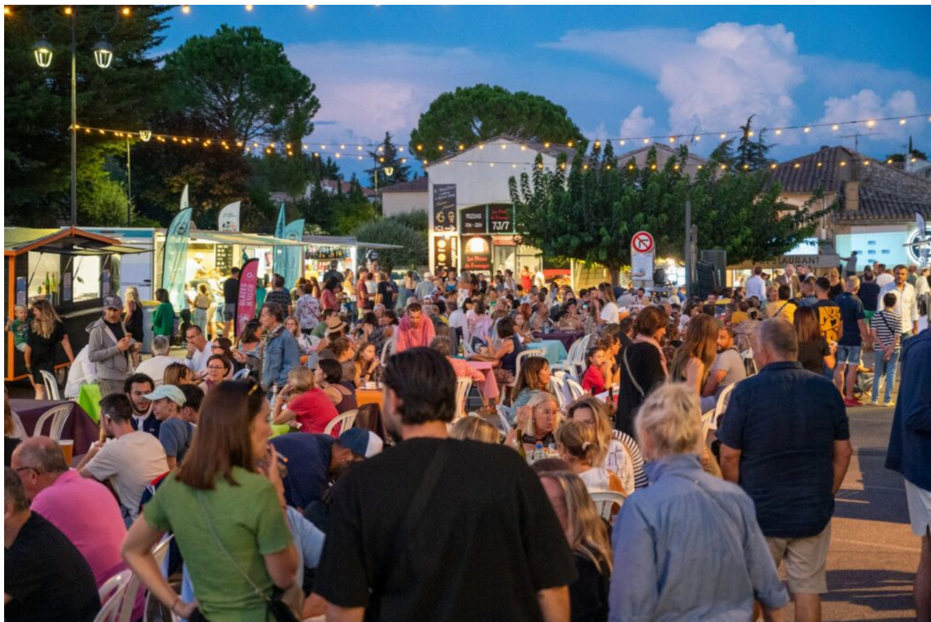
La soirée des Défis Foodtruck.