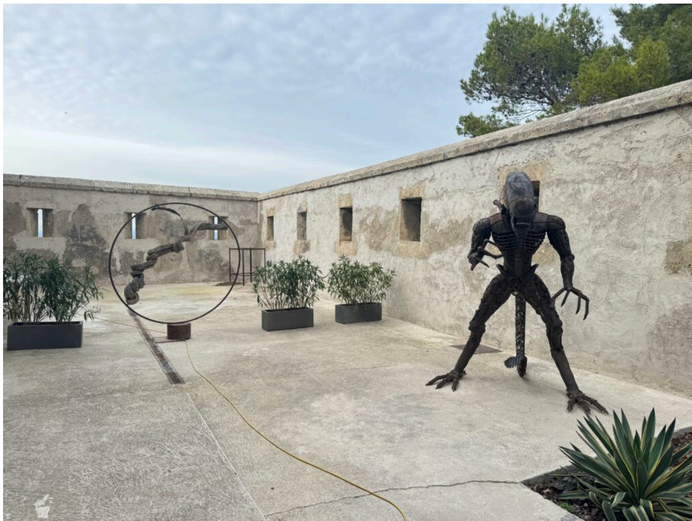
L'art, nouveau gardien des lieux

accueillant des musiciens et projetant des tableaux dans l'atrium. Des vernissages fréquents ainsi que des expositions de tableaux ont également eu lieu. Enfin, le site s'inscrit dans l'aménagement d'une nouvelle promenade touristique reliant les écluses de Fonsérannes et la Cathédrale de Béziers.