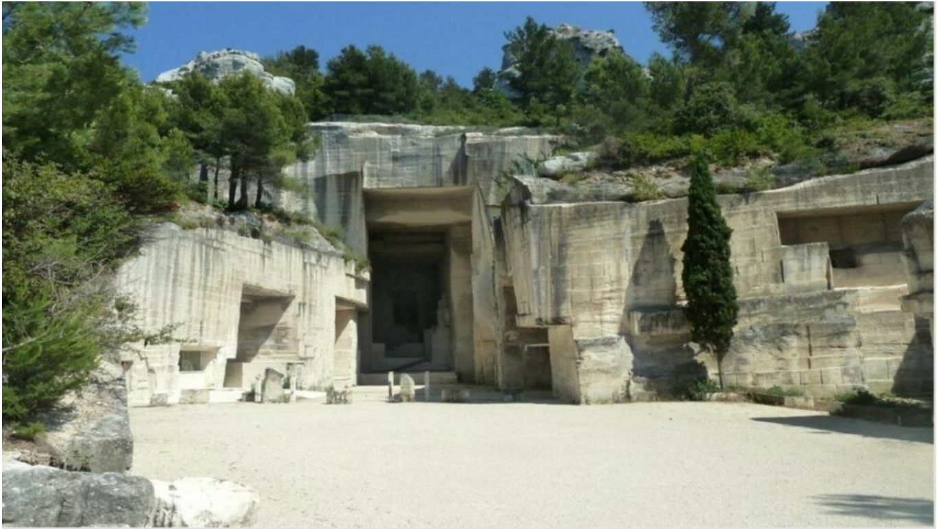
Entrée des Carrières de Lumières