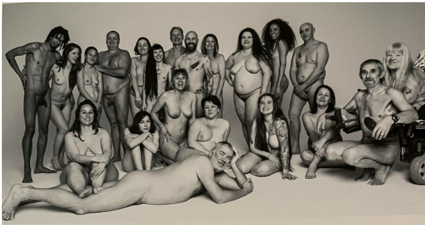
Les photos exposées sont de la photographe Tamara Hauvuy

« C'est une façon de prendre le contre-pied des réseaux sociaux, très exigeants sur l'apparence. Etant moi-même coach sportif je suis sensible à cela. Je rencontre beaucoup de personnes mal dans leur peau, bourrées de complexes, et cela alors qu'elles ont effectué un immense travail sur elle-même, leur corps, mais conservent une mauvaise image d'elles. Je trouve cela très dommage.»