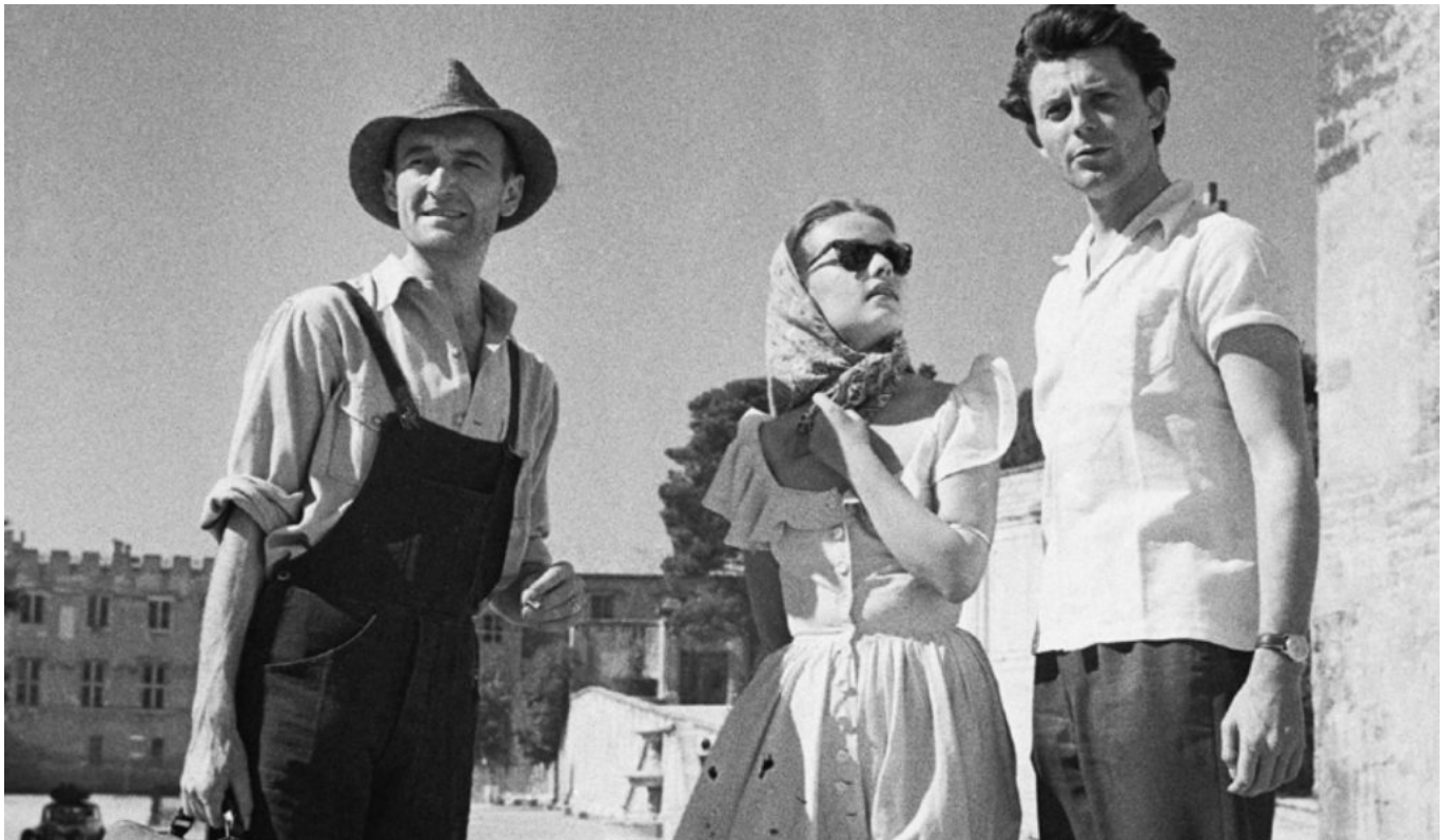
Jean Vilar, Jeanne Moreau et Gérard Philippe sur la place du Palais des Papes devant le Musée du Petit Palais