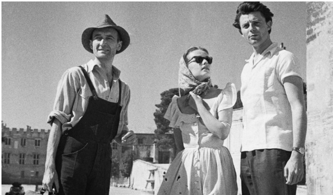
Jean Vilar, Jeanne Moreau et Gérard Philippe sur la place du Palais des Papes devant le Musée du Petit Palais