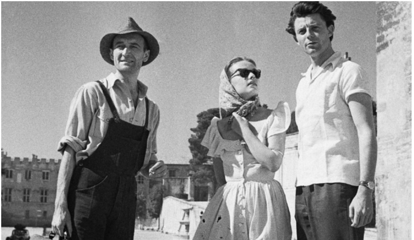
Jean Vilar, Jeanne Moreau et Gérard Philippe sur la place du Palais des Papes devant le Musée du Petit Palais