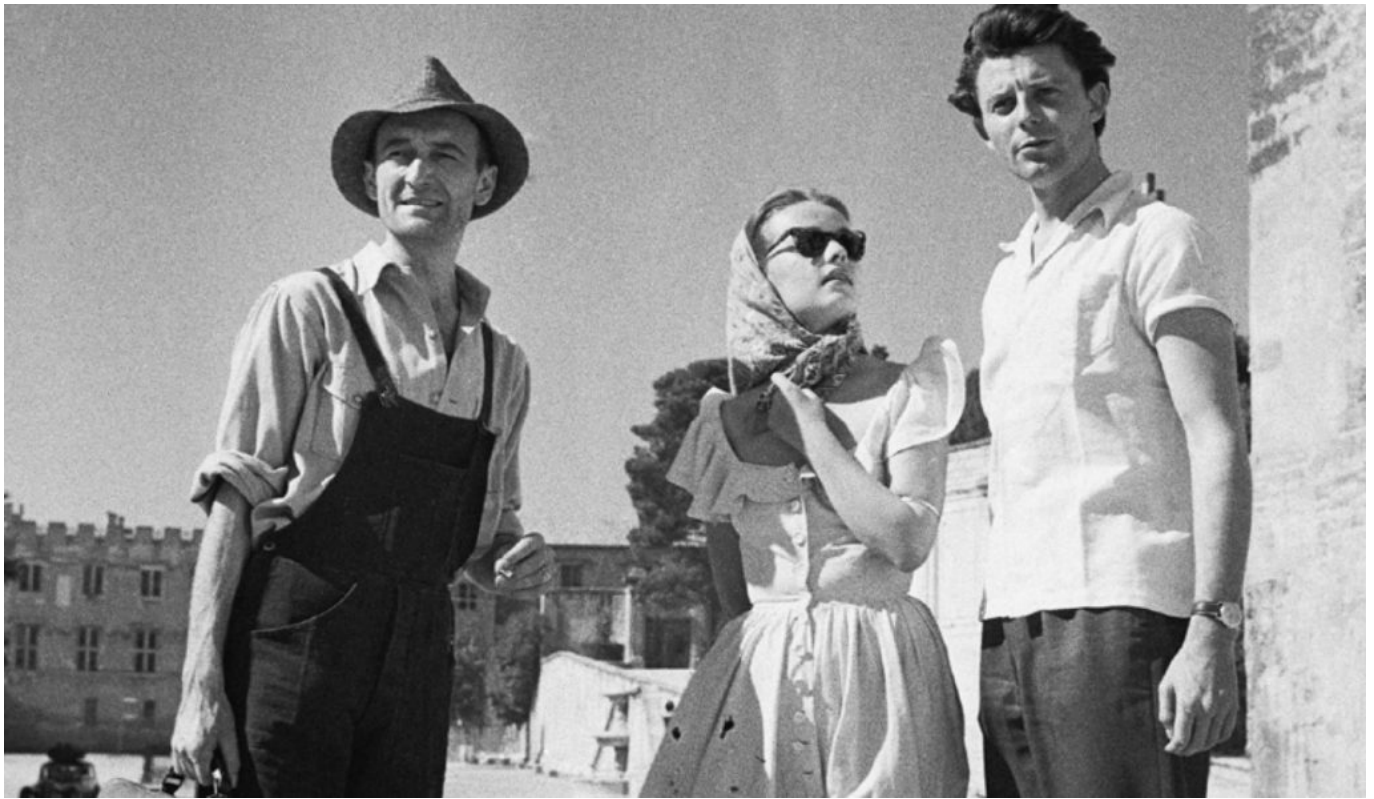
Jean Vilar, Jeanne Moreau et Gérard Philippe sur la place du Palais des Papes devant le Musée du Petit Palais