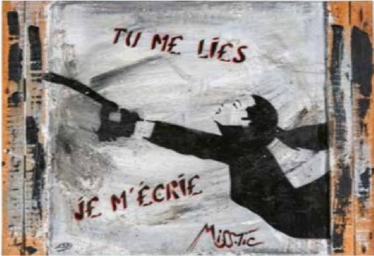
MISSTIC (1956-2022) : Tu me lis, je m'écris. Pochoir sur toile et bois. Signé en bas et daté 1990. Dimensions: 72x103 cm. 2 000/3 000 €