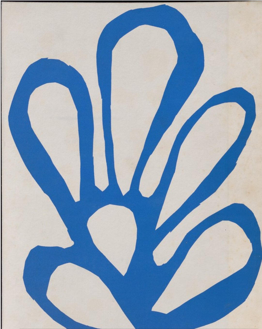
Apollinaire copyright succession Matisse