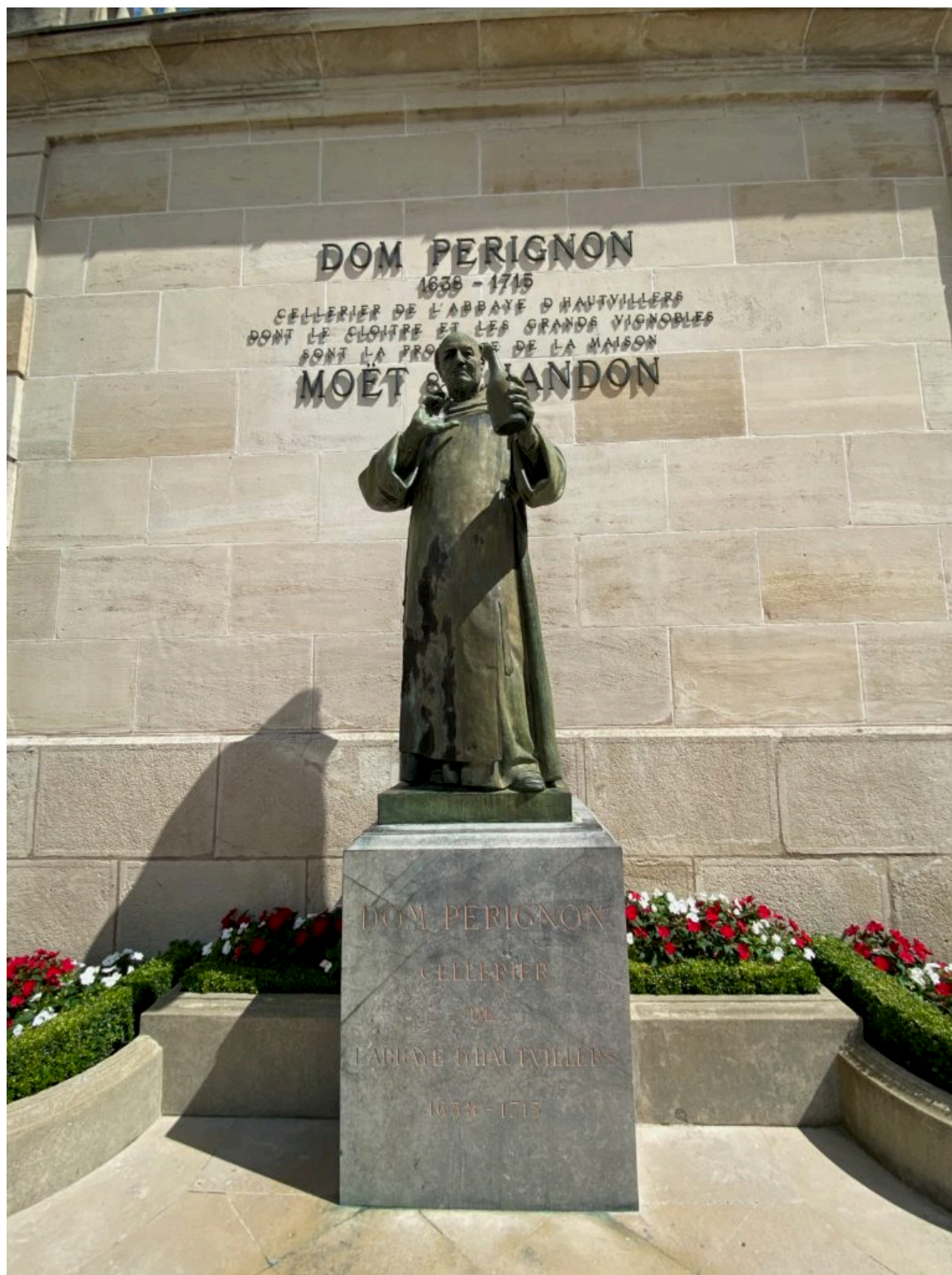
La statue de Dom Pérignon, considéré comme l'inventeur de la vinification des vins effervescents.