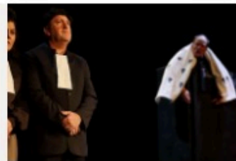
La Lionne, Gisèle Halimi