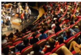
Collèges au concert