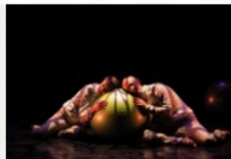
Le K Outchou