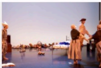
L'Histoire du soldat