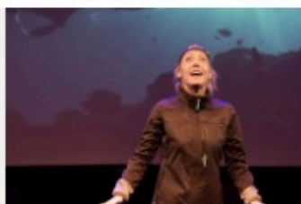
Le Monde du Silence Gueule !