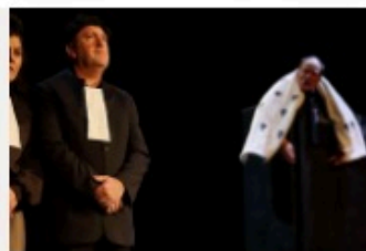
La Lionne, Gisèle Halimi