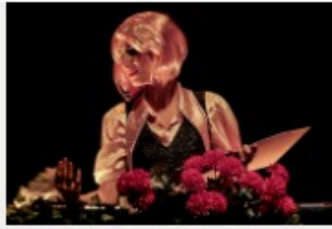
Le Petit Barbier