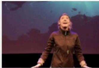
Le Monde du Silence Gueule !