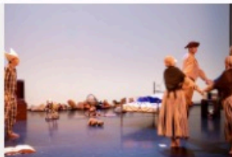
L'Histoire du soldat