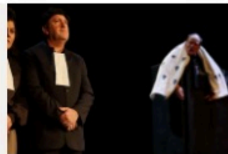
La Lionne, Gisèle Halimi