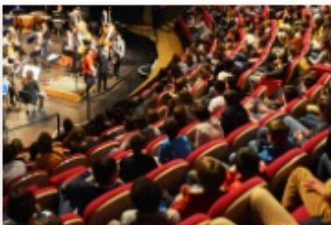
Collèges au concert