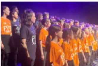
Pop The Opera