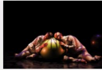
Le K Outchou