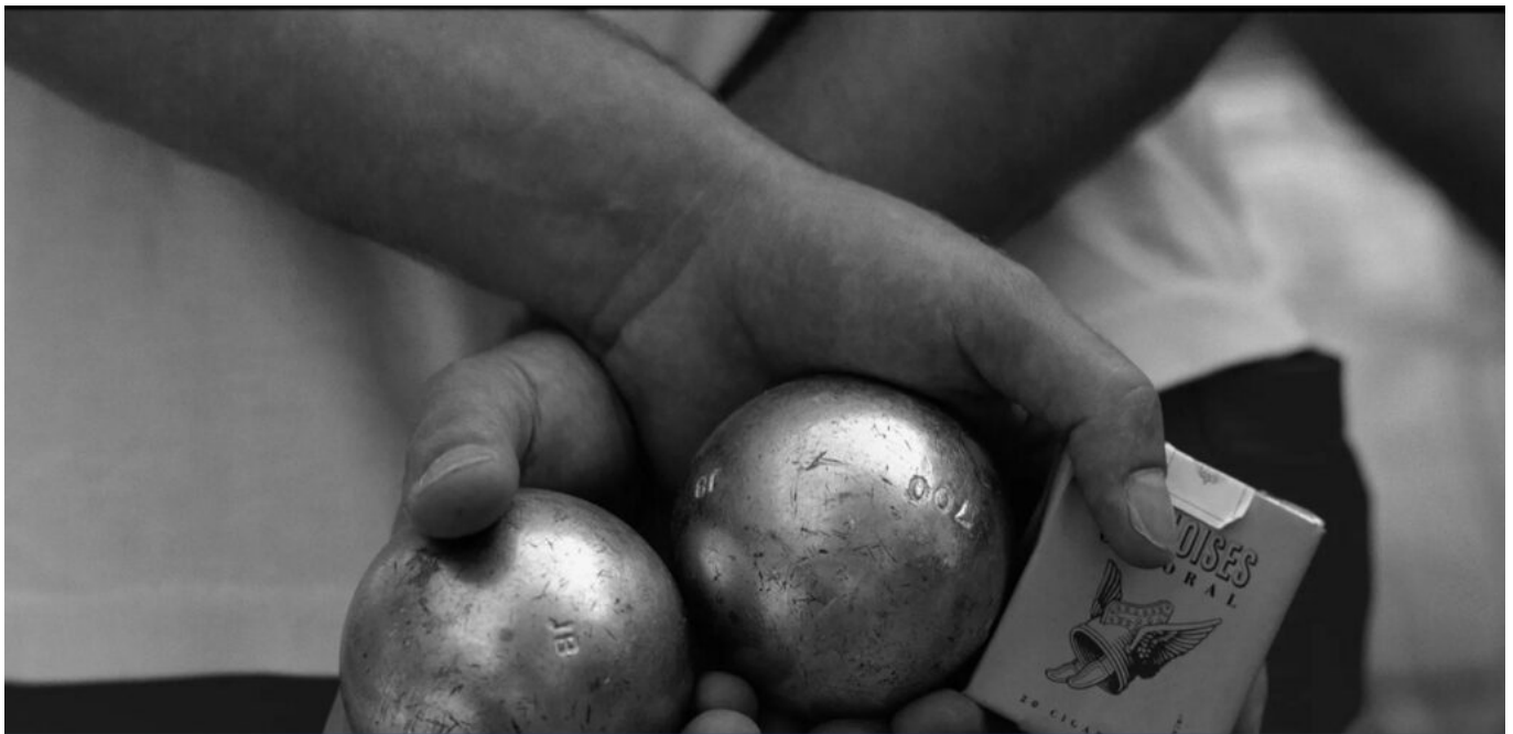
Dr Hans Silvester