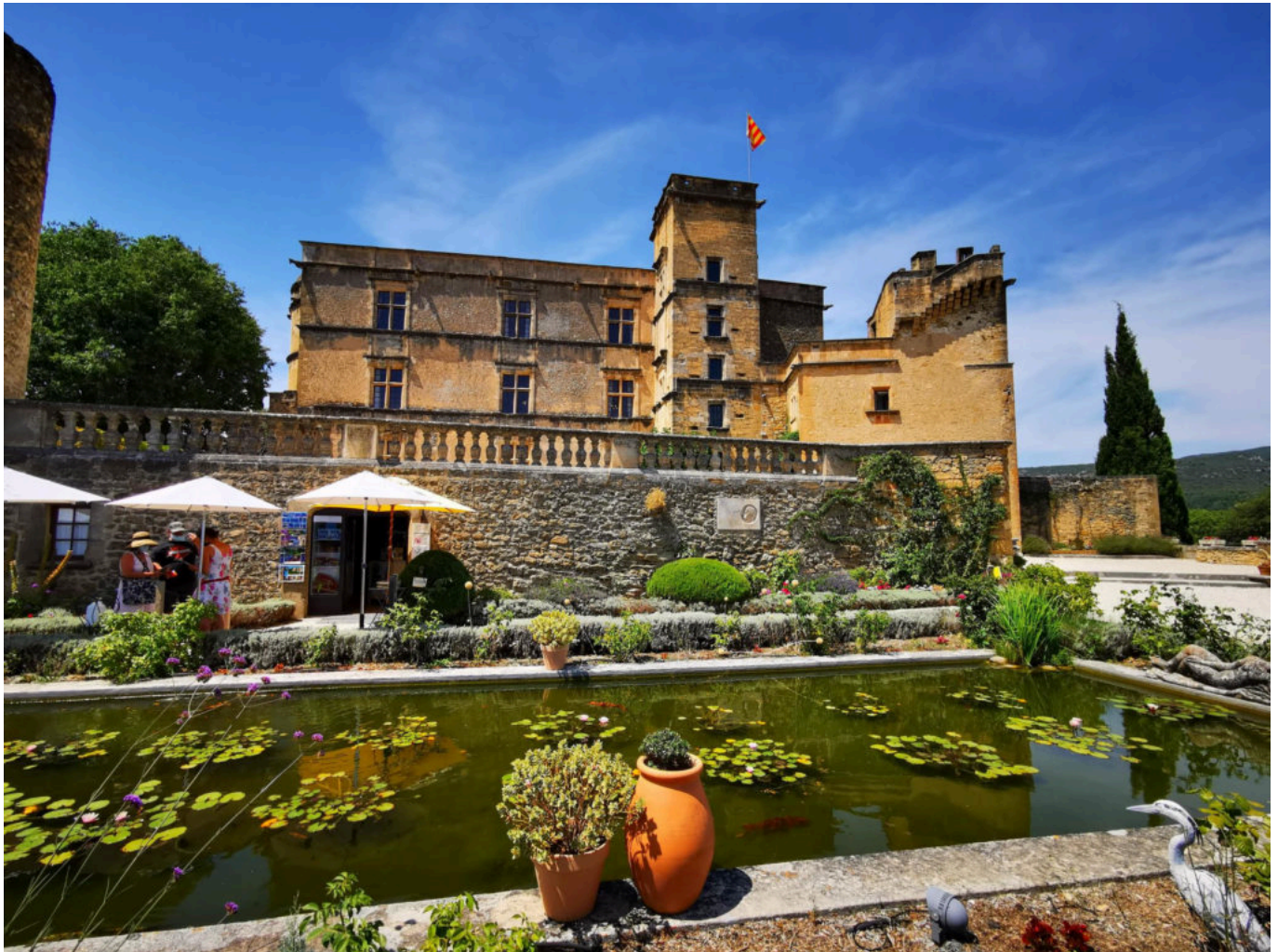
Château de Lourmarin.

guidées sont proposées pour découvrir ce bel ensemble, muni d'un carnet d'explications.