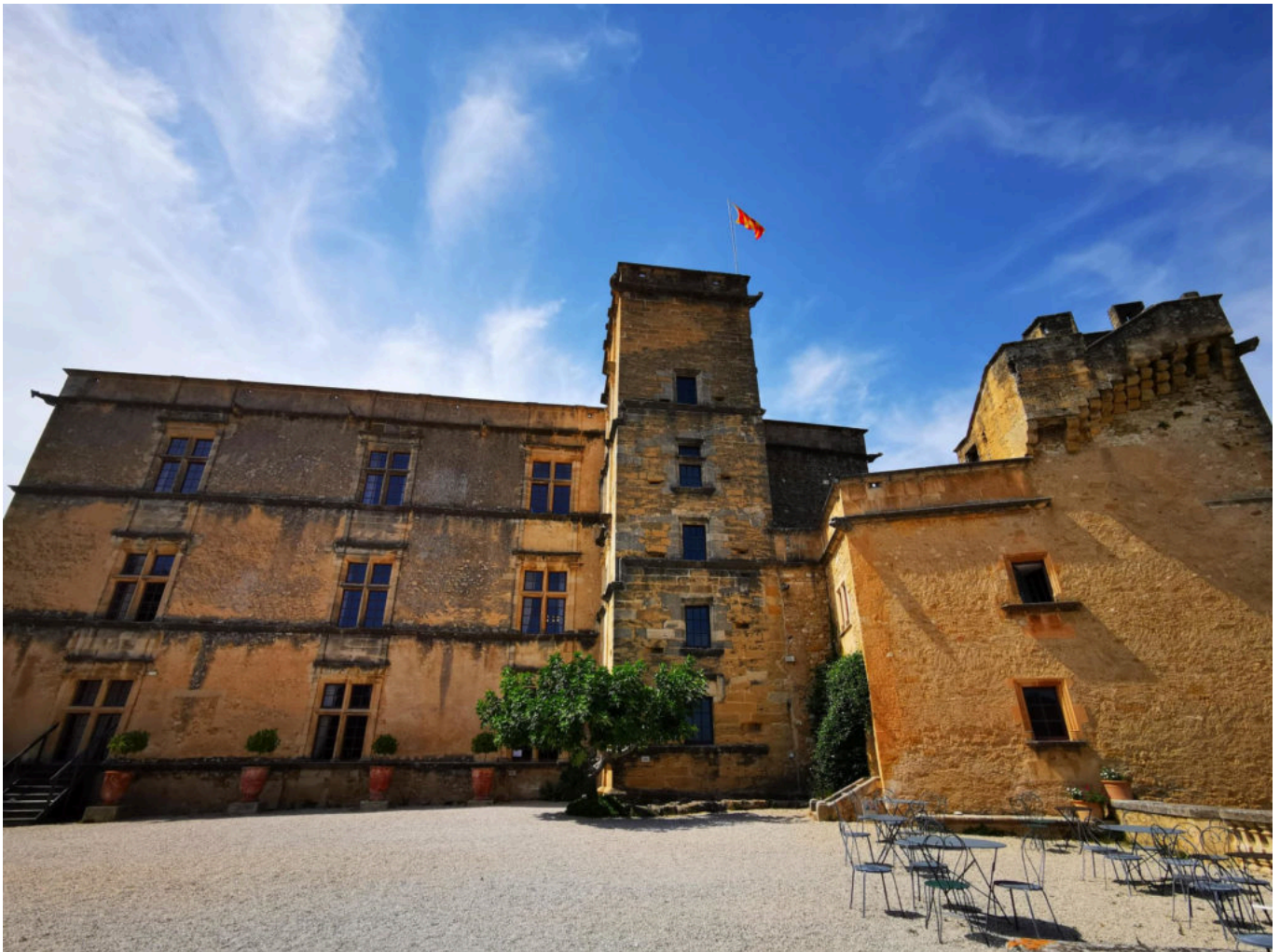
Château de Lourmarin.