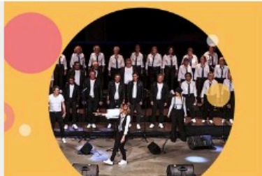
Berger Balavoine... La Story