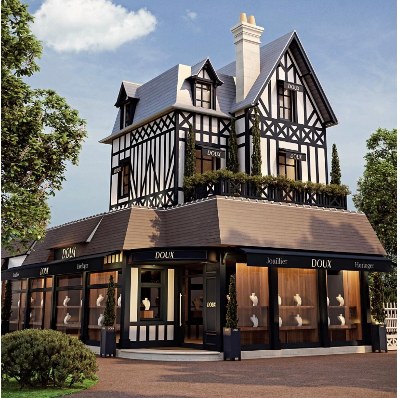
La future boutique Doux à Deauville