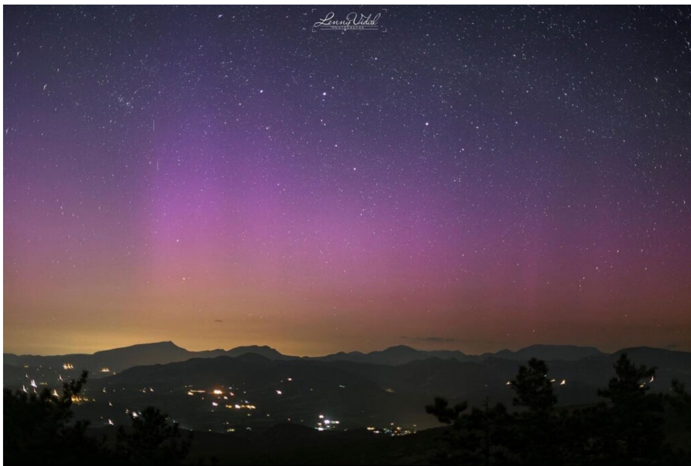
Photo prise par le photographe Lenny Vidal dans la nuit du samedi 11 au dimanche 12 mai. ©Lenny Vidal