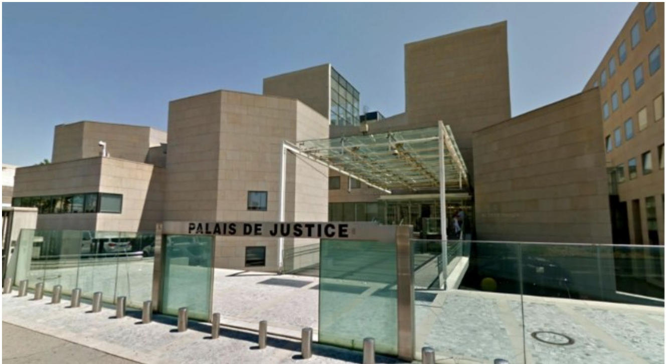
Palais de Justice d'Avignon

Ecrit par Mireille Hurlin le 14 février 2023