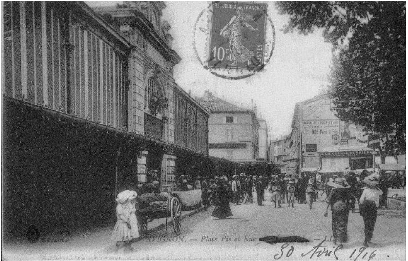
Les Halles en 1914.