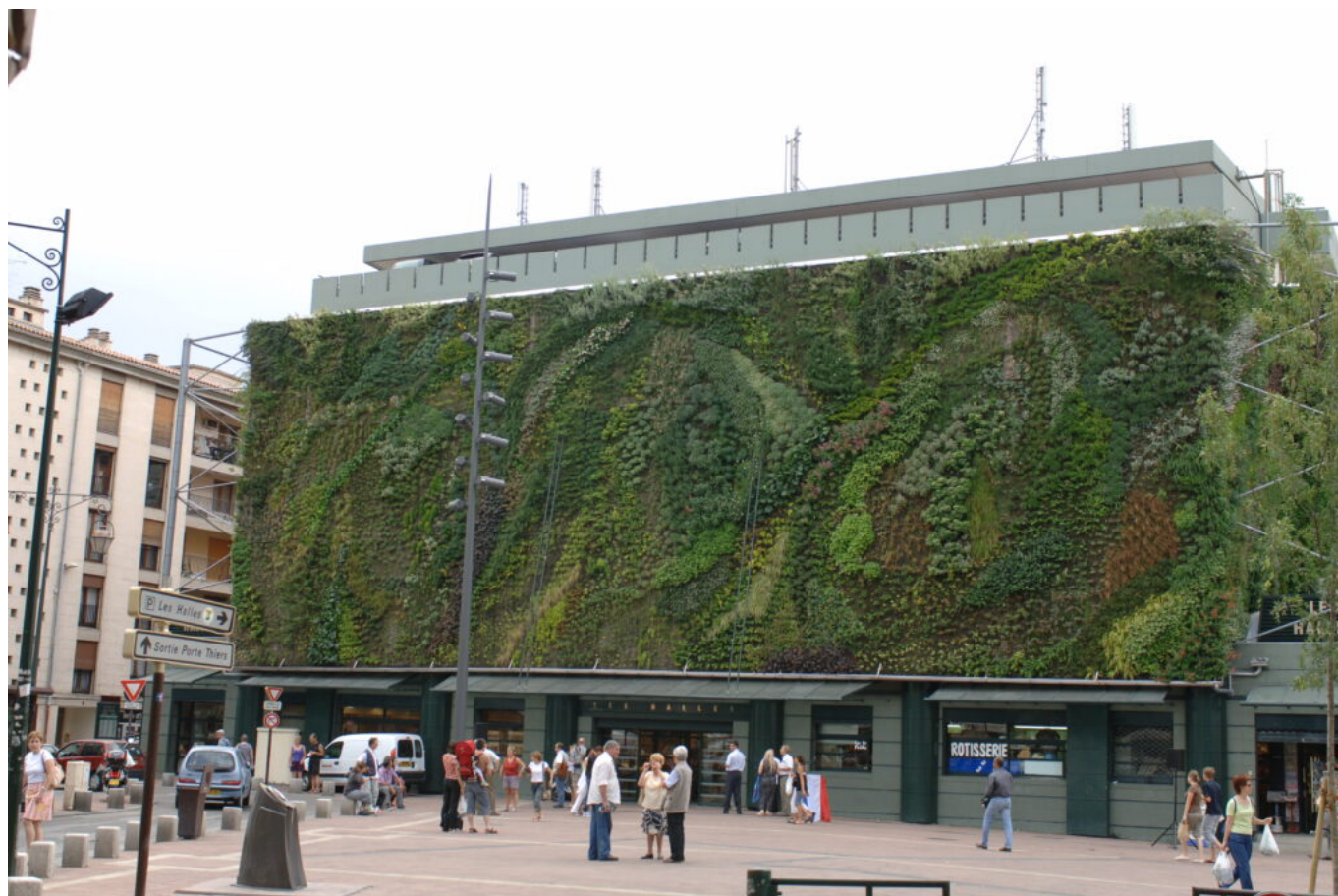
Inauguration du mur végétal des halles le 17 juin 2006.

Ecrit par Andrée Brunetti le 1 octobre 2024