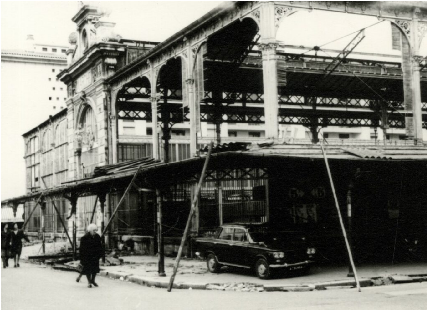
Les Halles en cours de démolition en 1972. Fond privé. Archives municipales. Anonyme. Photographie, 13X18

Ecrit par Andrée Brunetti le 1 octobre 2024