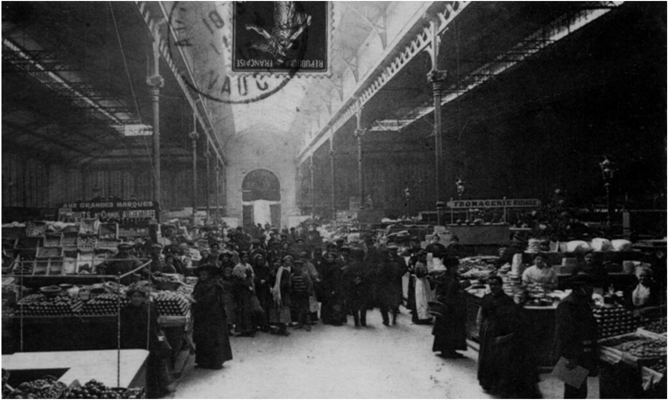
Intérieur des Halles. Collection Bayard. B.B Imprimerie. 9×14

Ecrit par Andrée Brunetti le 1 octobre 2024