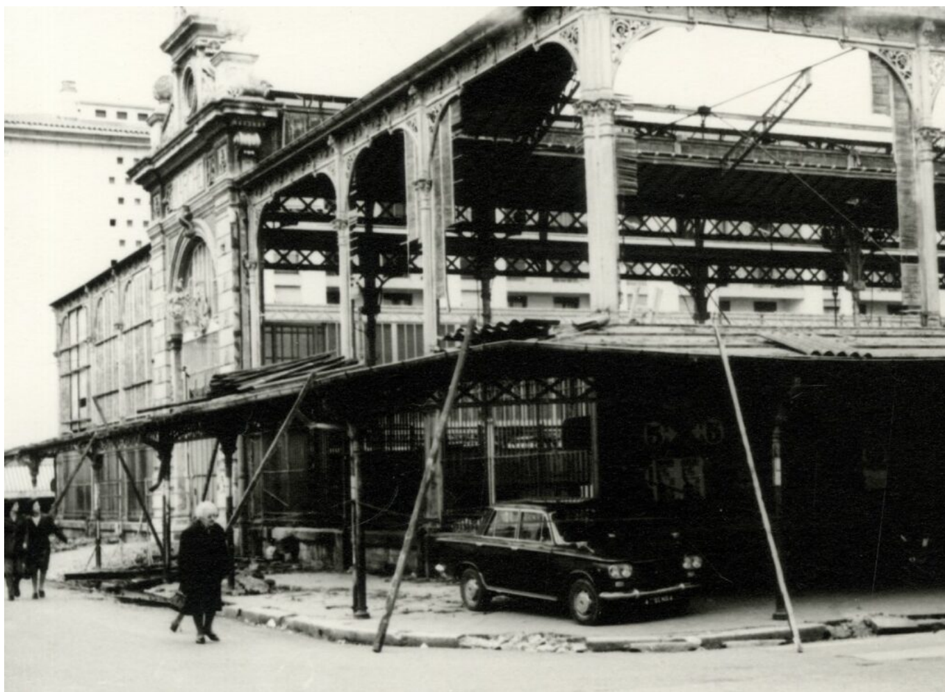
Les Halles en cours de démolition en 1972. Photographie, 13X18

Ecrit par Andrée Brunetti le 1 octobre 2024