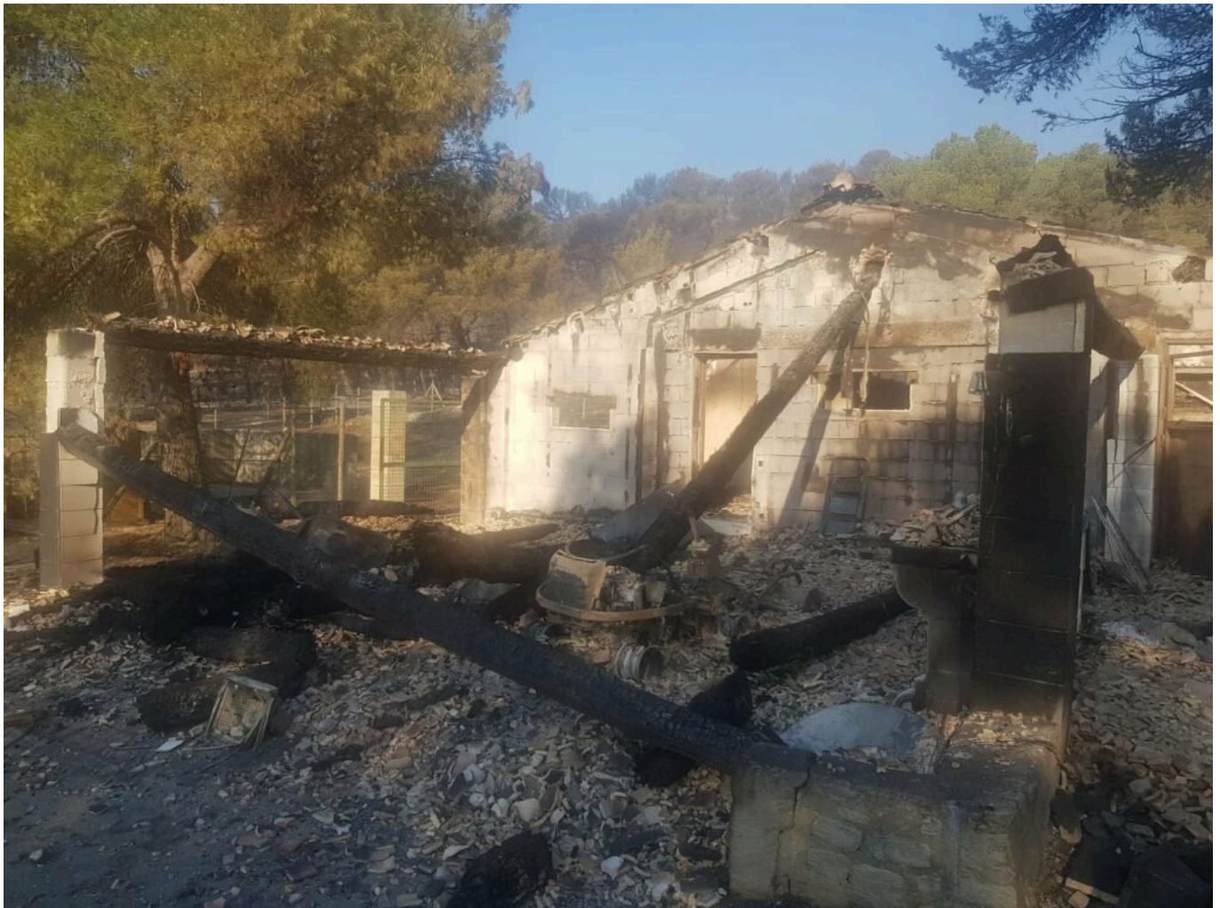
Dégâts constatés par la commune de Barbentane.

Ecrit par Laurent Garcia le 15 juillet 2022