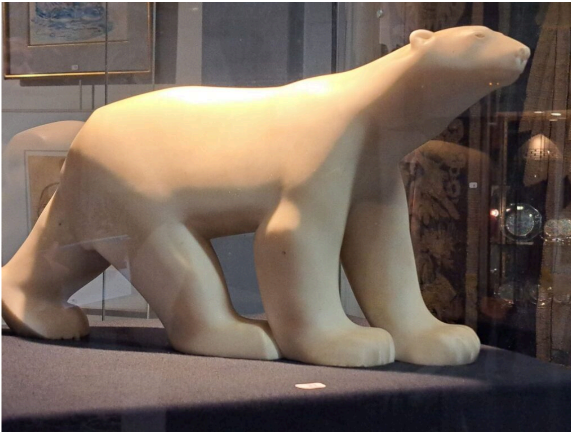
Ours Blanc de François Pompon