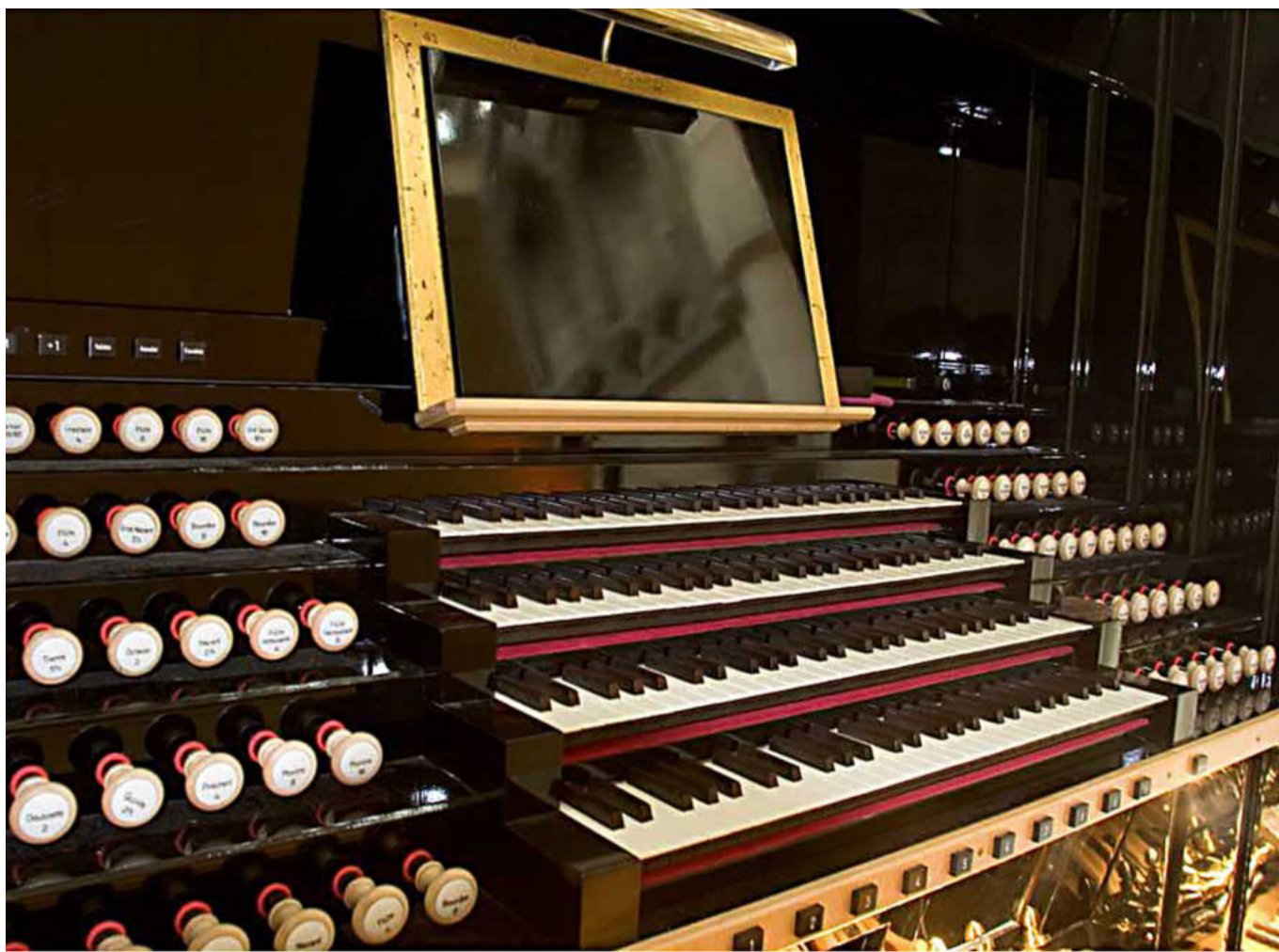
Console de l'orgue d'Evreux