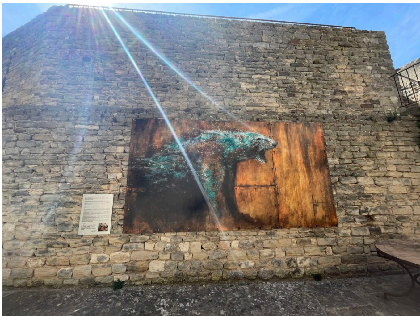
Œuvre de Sandrot sur un mur d'une cour du Château du Barroux

Ecrit par Mireille Hurlin le 29 avril 2024