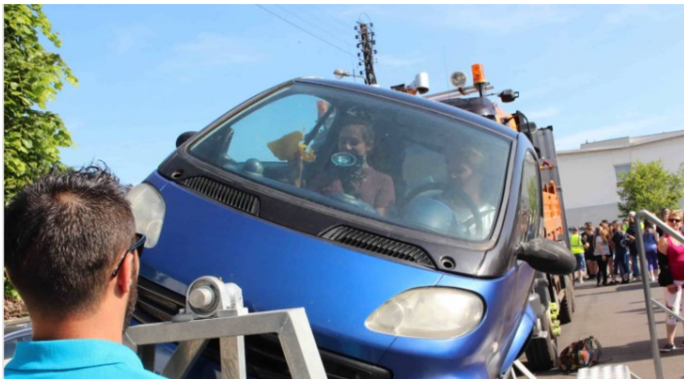
La voiture tonneau