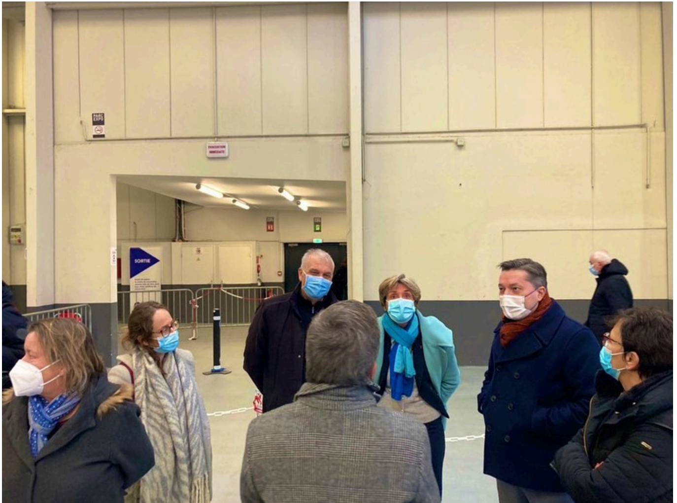
Bertrand Gaume, préfet de Vaucluse, et Cécile Helle, maire d'Avignon, au centre de vaccination départemental de Vaucluse.

Lire aussi : Vaccination : le Vaucluse passe à la vitesse supérieure