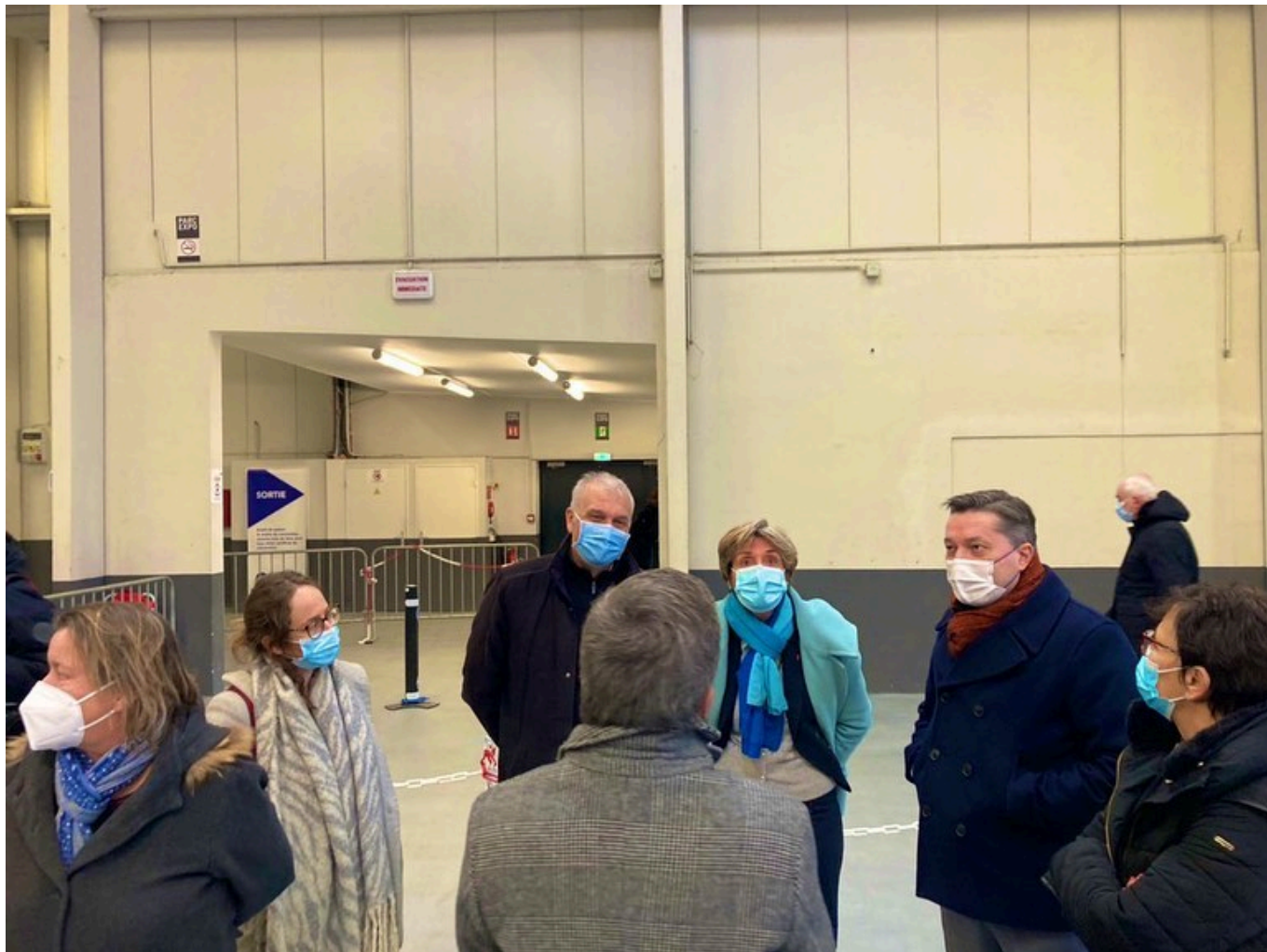
Bertrand Gaume, préfet de Vaucluse, et Cécile Helle, maire d'Avignon, au centre de vaccination départemental de Vaucluse.

Lire aussi : Vaccination : le Vaucluse passe à la vitesse supérieure