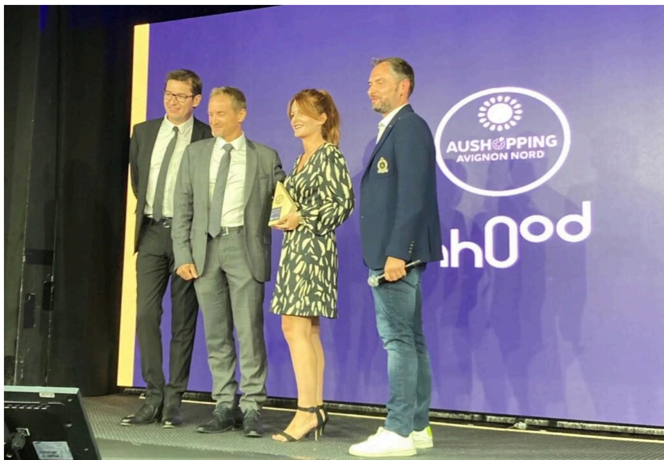
Une partie de l'équipe de Nhood recevant le trophée.

Parmi les centres commerciaux primés, il y a le centre Aushopping Avignon Nord, situé au Pontet, dont Nhood est le gestionnaire mandaté par l'entreprise Ceetrus qui en est propriétaire. Nhood a remporté un trophée dans la catégorie 'marketing' pour son Festival d'été, dont la seconde édition a eu lieu du 1er au 30 juillet dernier. Une manifestation jugée pleine d'ampleur associant culture et festivités par le jury constitué de professionnels du secteur.