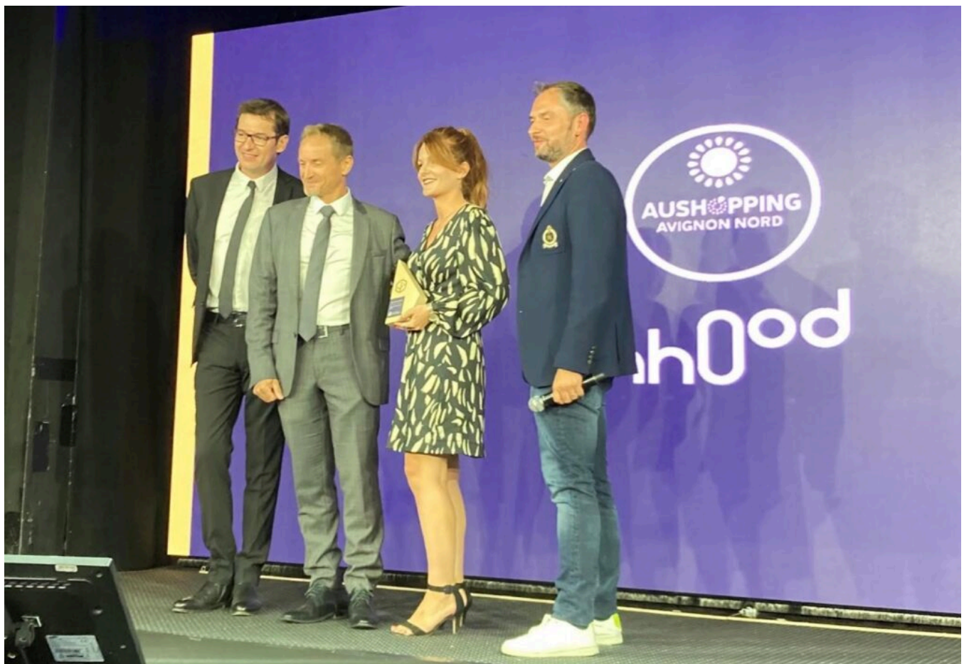
Une partie de l'équipe de Nhood recevant le trophée.

Parmi les centres commerciaux primés, il y a le centre Aushopping Avignon Nord, situé au Pontet, dont Nhood est le gestionnaire mandaté par l'entreprise Ceetrus qui en est propriétaire. Nhood a remporté un trophée dans la catégorie 'marketing' pour son Festival d'été, dont la seconde édition a eu lieu du 1er au 30 juillet dernier. Une manifestation jugée pleine d'ampleur associant culture et festivités par le jury constitué de professionnels du secteur.