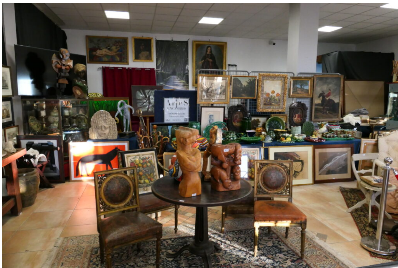
Exposition de la collection Emile Garcin

«Est-ce que je suis stressée avant la vente ? Oui, très, très. Comment je me prépare ? Je m'isole dans un coin, je pense à la vente, je me mets dans ma bulle. Je me prépare mentalement. Le début de la vente ? C'est le plus dur. Il faut mettre l'ambiance, emporter les gens avec soi, créer les conditions de l'envie d'acheter. Est-ce que les gens me contactent à l'avance en me disant qu'ils sont intéressés par certains lots ? Oui, bien sûr, et je garde tout cela secret. On ne peut pas non plus préjuger de ce qui va se passer. C'est la surprise pour tout le monde y compris pour nous. Il y a des lots que l'on met très longtemps à préparer et qui passent en quelques minutes. On n'a pas le temps de penser, de s'attacher au lot qu'il est déjà passé. Une enchère dure très peu de temps. Le maillet a à peine frappé que vous êtes déjà passé au lot suivant. Il faut tenir le rythme.»