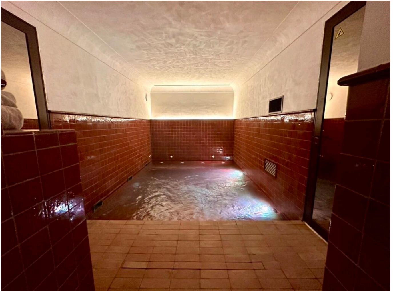
Le Bain romain au spa.