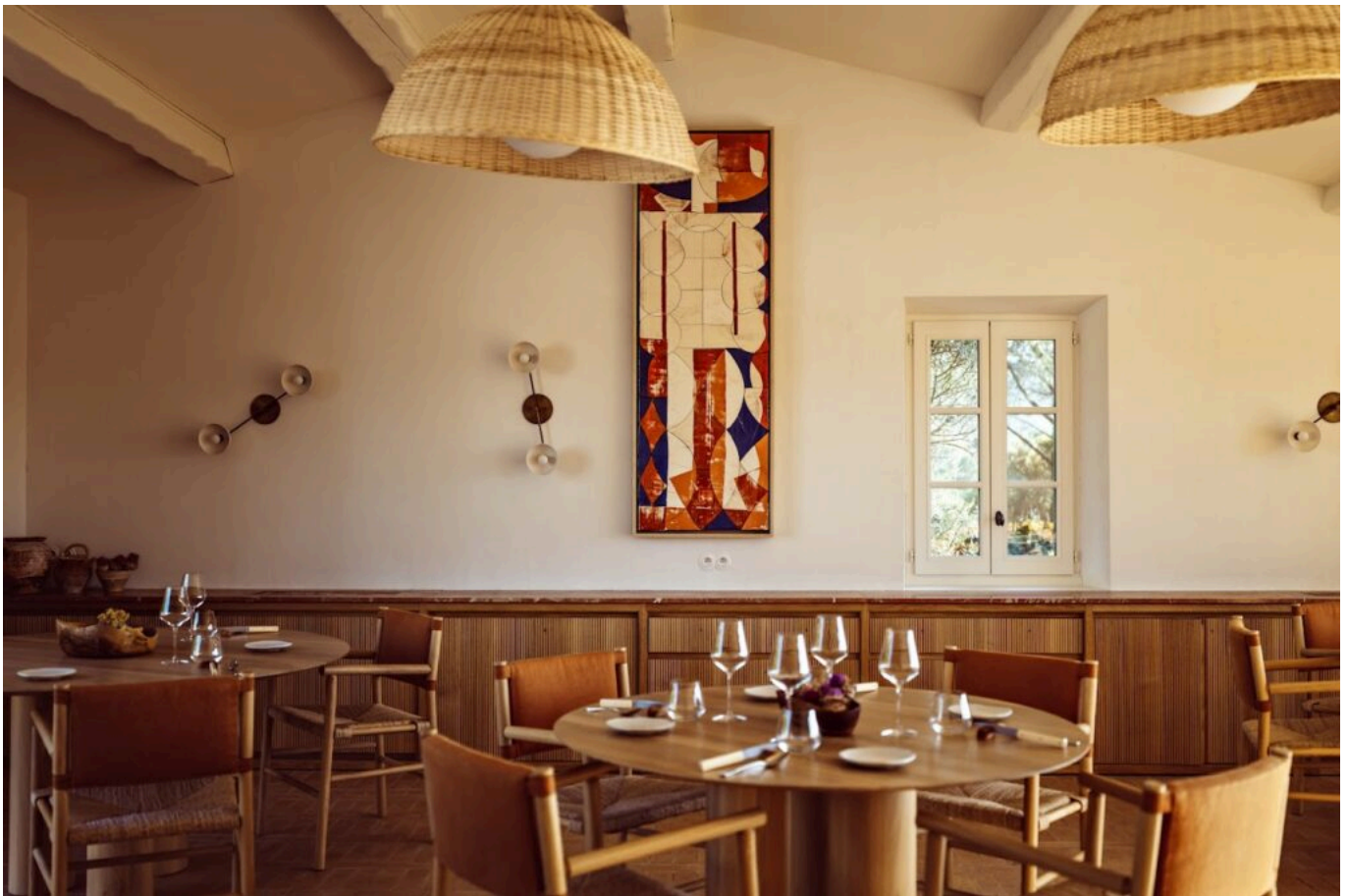
La Bastide.

La Bastide, qui possède une étoile au Guide Michelin. C'est désormais Noël Bérard qui en tient les rennes. Il peut accueillir jusqu'à 35 personnes. Dans les deux restaurants, vous trouverez des produits locaux, préparés avec passion pour vous proposer un repas de qualité, à l'image de la Provence.