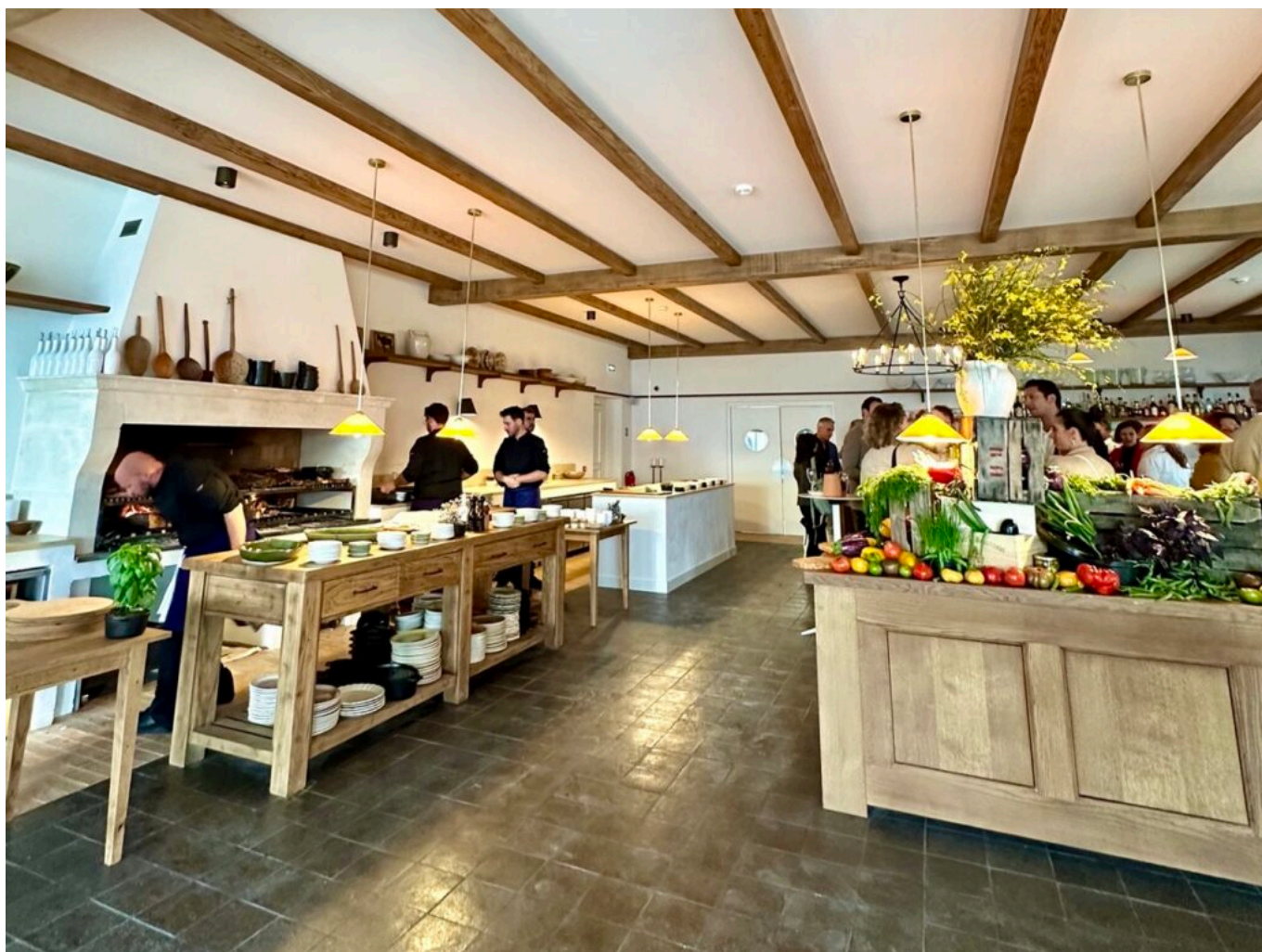
La Bergerie.