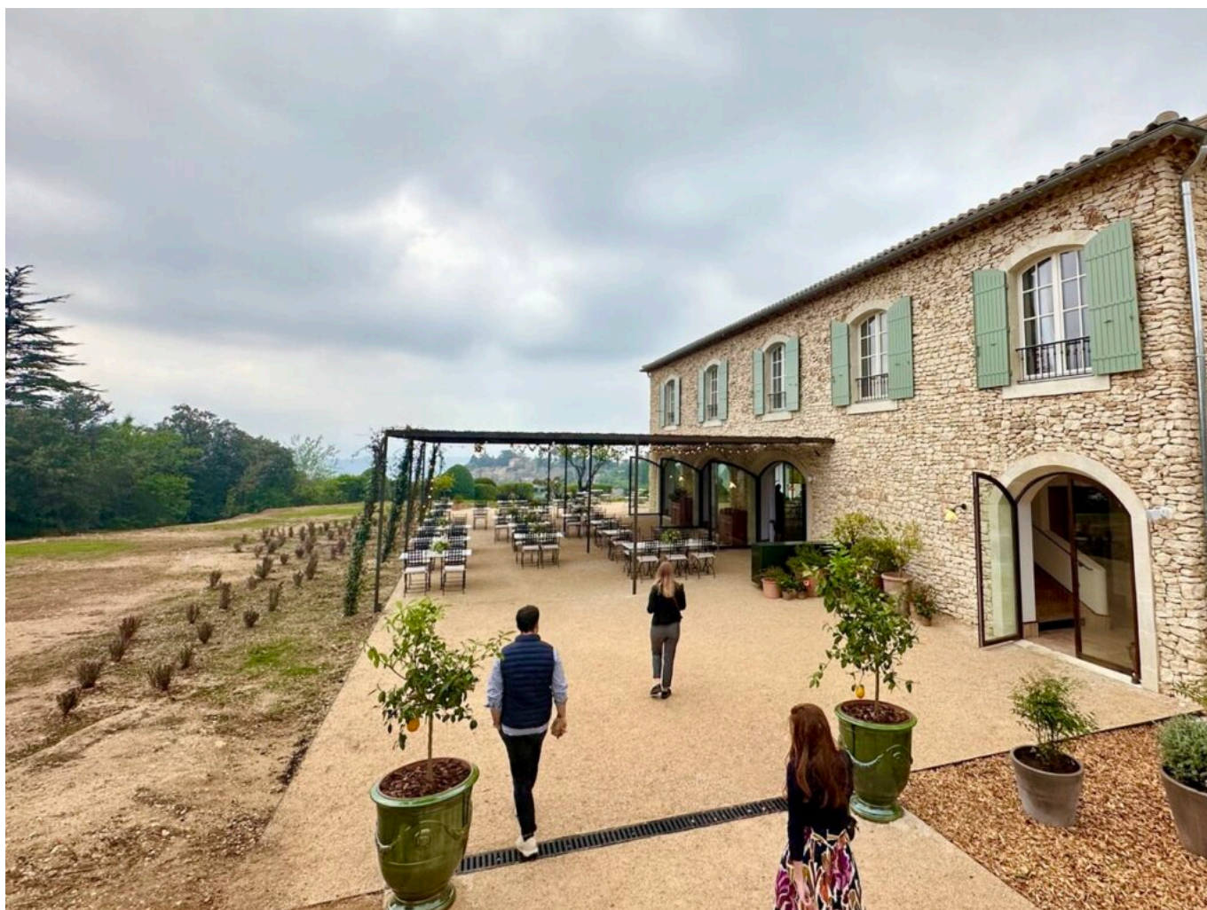
La nouvelle Bergerie.