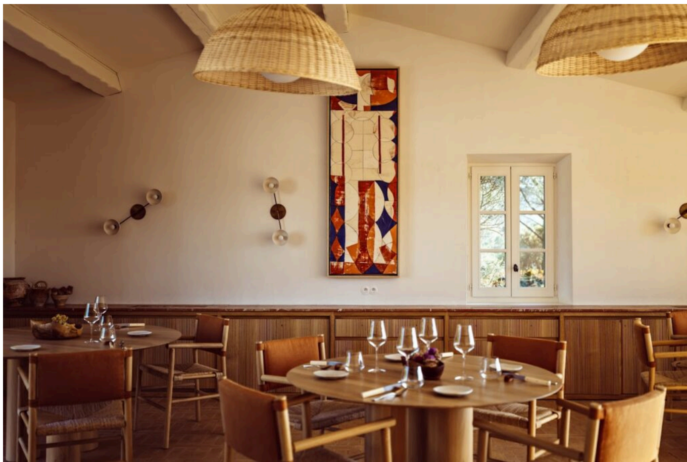
La Bastide.

La Bastide, qui possède une étoile au Guide Michelin. C'est désormais Noël Bérard qui en tient les rennes. Il peut accueillir jusqu'à 35 personnes. Dans les deux restaurants, vous trouverez des produits locaux, préparés avec passion pour vous proposer un repas de qualité, à l'image de la Provence.